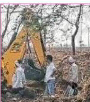
शेतारस्त्याच्या वहिवाटीवरून दोन शेतकऱ्यांमध्ये सुरू असलेला