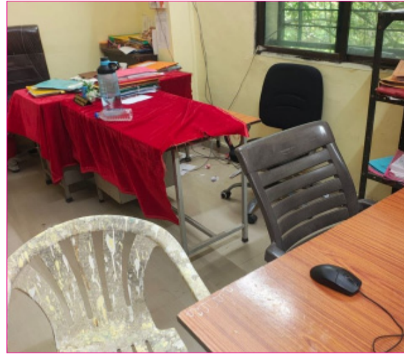
एकही कर्मचारी उपस्थित नसल्याचे आढळून आले. विभागातील कागदपत्रे, साहित्य अस्ताव्यस्त व अस्वच्छता

ठिकाणी पंधरे व दिवे सुरू असूनही कर्मचारी जागेवर नसल्याने नागरिकांनी तीव्र नाराजी व्यक्त केली. महाराष्ट्र शासनाने प्रशासकीय कामकाज अधिक कार्यक्षम करण्यासाठी पाच दिवसांचा आठवडा लागू करत कार्यालयीन वेळ सकाळी ९.४५ ते सायंकाळी ६.१५ अशी निश्चित केली आहे. मात्र या नियमांचे पालन स्थानिक नगर परिषदेत कितपत होते, याबाबत प्रश्न उपस्थित होत आहेत. मंगळवारी सकाळी साडेदहा वाजताच्या सुमारास नगर परिषद कार्यालयाची पाहणी केली असता बांधकाम विभागात