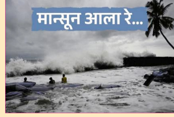
मान्सून आला रे...

निर्माण झाला. हवामान विभागाने सिंधुदुर्ग जिल्ह्यात १० ते २० मि.मी. पावसाचा अंदाज व्यक्त केला असून जिल्ह्यासाठी येलो अलर्ट जारी करण्यात आला आहे. त्यामुळे नागरिकांना सतर्क राहण्याचे आवाहन करण्यात आले आहे. कोकण