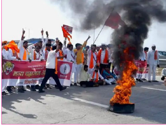
झाला आहे. या पार्श्वभूमीवर शिवसेनेने थेट रस्त्यावर उतरून सरकारला इशारा दिला. आंदोलनादरम्यान मोठ्या प्रमाणात पोलिस बंदोबस्त तैनात

पार पडले. समृद्धी महामार्गावरील इंटरचेंज क्रमांक १९, जांबरगाव येथे हजारो शिवसैनिकांनी एकत्र येत सरकारविरुद्धात घोषणाबाजी केली. विशेष म्हणजे, समृद्धी महामार्ग रोखून आंदोलन करण्याची ही पहिलीच वेळ असल्याची चर्चा आंदोलनस्थळी होती. कांदा उत्पादक शेतकऱ्यांना योग्य दर मिळत नसल्याने त्यांची अवस्था बिकट झाली आहे. उत्पादन खर्च वाढत असताना बाजारात कांद्याला अत्यंत कमी भाव मिळत असल्याने शेतकरी हवालदिल