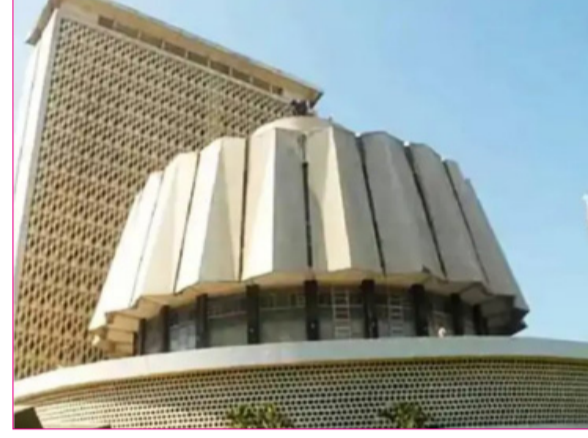
विधानपरिषदेच्या निवडणुकीचे संपूर्ण वेळापत्रक जाहीर झालेल्या या निवडणुकीच्या वेळापत्रका

सदस्यांपैकी २२ सदस्य हे मतदारसंघातील एकूण स्थानिक स्वराज्य संस्थांद्वारे निवडून दिले जातात आणि नियमानुसार, संबंधित मतदारसंघातील एकूण मतदारसंख्येपैकी किमान ७५ टक्के मतदारसंख्या उपलब्ध असल्यास ही निवडणूक घेता येते.