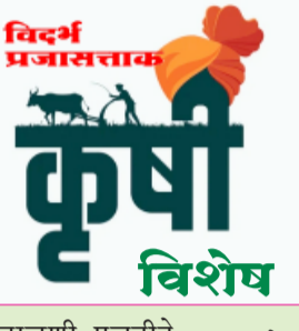
विदर्भ प्रजासत्ताक कृषी विशेष

ऊर्जास्रोत : ०.५ एच.पी. सिंगल फेज वीज मोटर उत्पादन गुणोत्तर सफाई कार्यक्षमता - सुमारे ९६% प्रतवारी कार्यक्षमता - सुमारे ९५% कार्यपद्धती सोयाबीन