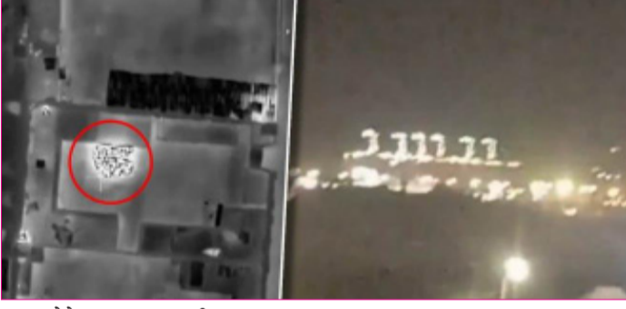
बाजारपेठेत घबराट पसरली.

पाकिस्तानी हवाई हल्ल्यांना प्रत्युत्तर म्हणून, तालिबानी सैन्याने सीमेवरील पाकिस्तानी लष्करी स्थानांवर हल्ला केला. लष्करी सैनिकांनी पाकिस्तानी सीमेत पुसून जलद हल्ले केले. अफगाणिस्तानचे लष्करप्रमुख फसिहुद्दीन फितरत यांनी आघाडीवर पोहोचून सैन्याच्या कारवायांचा आढावा घेतला. तालिबानी सैन्याने पाकिस्तानी लष्करी चौक्यांवरून भयंकर हल्ला केला, ज्यामुळे त्यांच्या सैनिकांना पळवू जावे लागले. अफगाण सैनिकांनी पाकिस्तानी चौक्या आणि वाहनांना आग लावली आणि नष्ट केले. शिवाय, अफगाणिस्तानने पाकिस्तानातील पेशावरमध्ये झेन हल्ला केला, ज्यामुळे