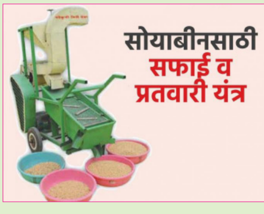
सोयाबीनसाठी सफाई व प्रतवारी यंत्र

या समस्येची गांभीर्याने दखल घेऊन झअत-ज्ञेश्र डॉ. पंजाबराव देशमुख कृषी विद्यापीठ, अकोला येथील कापणी पथात अभियांत्रिकी व तंत्रज्ञान विभागात एक अत्यंत उपयुक्त, किफायतशीर आणि कार्यक्षम यंत्र विकसित करण्यात आले आहे. 'पं.दे.कृ.वि. मोबाईल सफाई