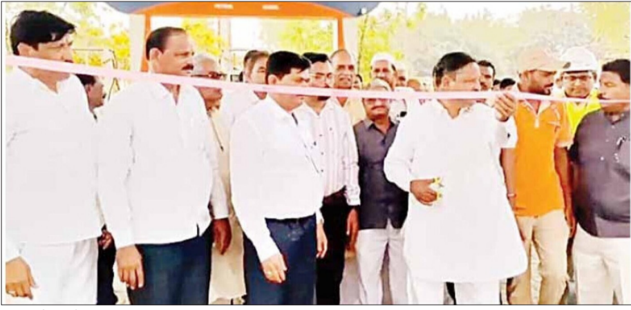
विदर्भ प्रजासत्ताक दि. २१ दर्यापूर

सहकार क्षेत्राला चालना; पर्यावरणपूरक ऊर्जेचा नवा अध्याय