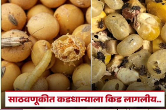
साठवणूकीत कडधान्याला किड लागलीय..

पूर्ण वाढलेला भुंगेरा गडद चॉकलेटी रंगाचा ६ ते ७ मिमी लांब