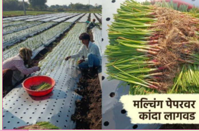
मल्लिंग पेपरवर कांदा लागवड

तीन लाख आठ हजार कांदा रोपे लावली आहेत. कांदा उत्पादक पट्ट्यात गेल्या काही वर्षात लागवड पद्धतीत बदल होत आहे. जिल्ह्यात अलीकडे मल्लिंग पेपरवर लागवड होत आहे. ही पद्धत उत्पादन वाढ, पाण्याची बचत, मजूर टंचाईसाठी प्रभावी आहेत.