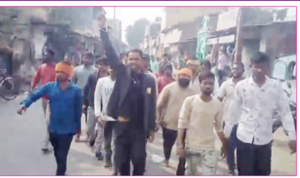
परवानगीशिवाय कोणतेही बांधकाम करण्यास मनाई आहे. मात्र काही महिला व पुरुषांनी

विदर्भ प्रजासत्ताक दि. २७ अचलपूर : येथील बुंदेलपुरा भागातील डॉ. बाबासाहेब आंबेडकर पुतळ्याजवळ शासनाने प्रतिबंधित घोषित केलेल्या रिक्त जागेवर रविवारी काही नागरिकांनी मंदिर उभारणीचा प्रयत्न केल्याने परिसरात तणावाचे वातावरण निर्माण झाले. माहिती मिळताच अचलपूर पोलिसांनी तत्काळ घटनास्थळी धाव घेऊन कठोर भूमिका घेत परिस्थिती नियंत्रणात आणली. सदर जागेवर शासनाच्या