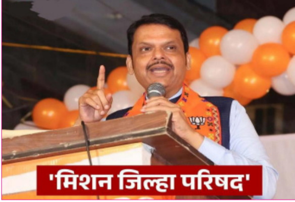
'मिशन जिल्हा परिषद'

विदर्भ प्रजासत्ताक दि. २७ मुंबई - राज्यातील महानगरपालिकांच्या निवडणुकांचा धुराळा शांत झाल्यानंतर आता जिल्हा परिषद आणि पंचायत समित्यांच्या निवडणुकांची रणधुमाळी सुरु झाली असून संपूर्ण राज्यात राजकीय वातावरण कमालीचे तापले आहे. सर्वच प्रमुख पक्षांचे दिग्गज नेते प्रचाराच्या मैदानात उतरले असतानाच, मुख्यमंत्री देवेंद्र फडणवीस हे देखील आता जिल्हा परिषद आणि पंचायत समितीच्या निवडणुकीत प्रचारासाठी सक्रिय होणार आहेत. फडणवीस यांच्या प्रचार दौऱ्यामुळे कार्यकर्त्यांमध्ये नवा उत्साह संचारला असून आगामी काळात या निवडणुकांमध्ये मोठी चुरस पाहायला मिळणार आहे.