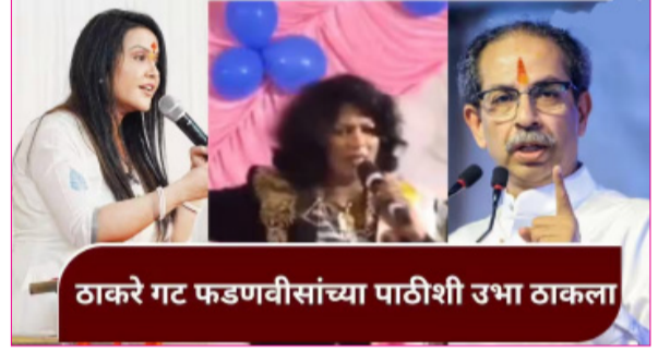
ठाकरे गट फडणवीसांच्या पाठीशी उभा ठाकला