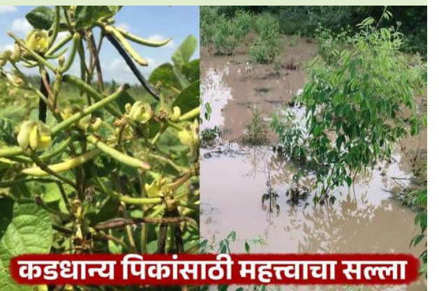
कडधान्य पिकांसाठी महत्वाचा सल्ला

मुग आणि उडीद पिकाची काढणी सुरु आहे तेव्हा शेंगा ओल्या राहणार