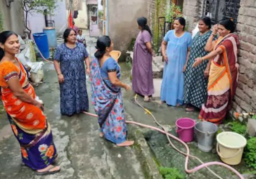
केंद्रावरील बिघाड दुरुस्तीसाठी प्रयत्न सुरू असल्याचे सांगत आज सायंकाळपर्यंत जुळ्या शहराचा पाणीपुरवठा सुरळीत होण्याची शक्यता असल्याचे म्हटले आहे. शहरातील मूलभूत गरजांपैकी

नागरिकांमध्ये संतापाची लाट आहे.सण-उत्सवाच्या दिवसांत घराघरात स्वच्छतेची तसेच पाहुणचाराची लगबग असते. अशा वेळी पाणीपुरवठा ठप्प झाल्यामुळे नागरिकांची प्रचंड गैरसोय झाली आहे. अनेकाना पिण्यासाठीसुद्धा पाणी मिळत नसल्याने खासगी टँकरवर अवलंबून राहावे लागत आहे. टँकरवाल्यांनी दर दुप्पट आकारल्याने सामान्य नागरिकांचे हाल झाले आहेत. पालिका प्रशासनाने जलशुद्धीकरण