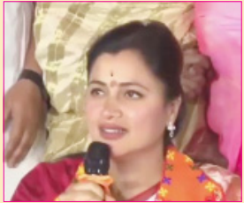
नवनीत राणा यांच्याविषयी अश्लील व अपमानास्पद भाषा

अमरावतीच्या माजी खासदार नवनीत राणा यांना सोशल मीडियावरून जीवे मारण्याची धमकी देण्यात आली आहे. इंस्टाग्रामवरील एका रीलच्या माध्यमातून ही धमकी देण्यात आली असून, संबंधित रीलमध्ये