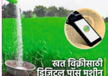
खत विक्रीसाठी डिजिटल पाँस मशीन