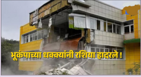
भूकंपाच्या धक्क्यांनी रशिया हादरले!

रशियाच्या कामाचात्तका द्वीपकल्पाच्या किनारपट्टीवर बुधवारी ८.८ रिश्टर स्केल तीव्रतेचा शक्तिशाली भूकंप झाला. या भूकंपानंतर मोठ्या प्रमाणात त्सुनामी आली असून, किनारपट्टीवरील लोकांना सुरक्षित ठिकाणी हलवण्यात येत आहे. दरम्यान, त्सुनामीचे व्हिडीओ सध्या सोशल मीडियावर मोठ्या प्रमाणात व्हायरल होत असून, त्यामध्ये समुद्रकिनार्यालागतच्या अनेक इमारती पाण्यात बुडालेल्या दिसत आहेत.