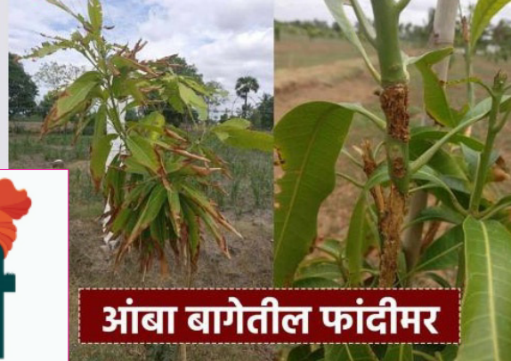
आंबा बागेतील फांदीमर

दि.३० विदर्भ प्रजासत्ताक आंबा बागेतीलफांद्या वाळण्याची किंवा मरण्याची समस्या अनेक कारणांमुळे येऊ शकते. आंबा बागेतील फांदीमर ही एक समस्या आहे जी आंबा पिकाला बाधित करते.