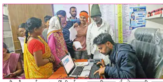
जुलैपर्यंत सर्व लाभार्थींची ई-केवायसी करून घेणे अनिवार्य केले आहे. त्यानुसार सर्व शिधापत्रिकाधारकांनी आधार प्रमाणीकरण ई-केवायसी करून घ्यावी, असे आवाहन जिल्हा पुरवठा अधिकाऱ्यांनी केले आहे. गेल्या काही वर्षांपासून हा विषय

वितरण करण्यात येते. अंत्योदय व प्राधान्य कुटुंब कार्डधारकांना शासनाकडून गहू, तांदुळ आदी धान्य वितरित केले जाते. मात्र, अनेकदा लाभार्थींना धान्य मिळत नसल्याची ओरड होते. शिवाय, काळ्या बाजारात धान्याची विक्री होत असल्याच्या घटनाही राज्यात समोर येत आहेत. काळ्या बाजाराला लगाम बसावा, याकरिता शासनाकडून लाभार्थींची पडताळणी सुरू केली आहे. ३१