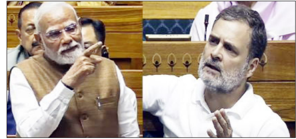
आज पुन्हा एकदा पंतप्रधानांवर टीका करताना त्यांनी म्हटले की, पंतप्रधान मोदी ट्रम्प यांचे नाव घेऊ

काँग्रेस नेते राहुल गांधी ऑपरेशन सिंदूर आणि त्यानंतर भारत-पाकिस्तानमध्ये झालेल्या युद्धविरामासून पंतप्रधान मोदींवर सतत टीका करत आहेत. काल त्यांनी लोकसभेत म्हटले की, पंतप्रधान मोदी स्पष्टपणे सांगू शकले नाहीत की, अमेरिकेचे अध्यक्ष डोनाल्ड ट्रम्प यांचा मध्यस्थीचा दावा खोटा आहे.