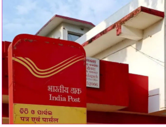
तांत्रिक यंत्रणा अपडेट केली जात आहे. या अपडेटचा उद्देश भारतीय टपाल विभागकडून पुरवल्या जाणाऱ्या सेवांची कार्यक्षमता, सुरक्षा आणि एकूण गुणवत्ता सुधारणे आहे. त्याच

केले आहेत. अशा परिस्थितीत, नवीन तंत्रज्ञानाकडे कर्मचाऱ्यांचा अपूर्ण असलेला सराव ग्राहकांसाठी अडचणीचे कारण बनू लागला आहे. राखीच्या हंगामात टपाल विभाग अपडेट करण्याच्या या प्रक्रियेमुळे बहिणींच्या चेहऱ्यावर चिंतेचे भाव आले आहेत. केंद्र सरकारने प्रशासकीय यंत्रणेची तांत्रिक व्यवस्था अधिक सक्रिय करण्यासाठी त्यात सुधारणा करण्यास सुरुवात केली आहे. त्यामुळे विविध विभागांची