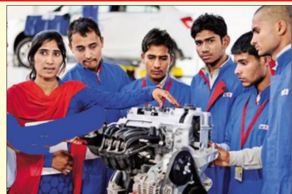
आय.टी.आय मध्ये क्रांती घडणार आहे, असे कौशल्य, रोजगार, उद्योजकता व नाविन्यता मंत्री मंगल प्रभात लोढा यांनी सांगितले. महाराष्ट्रातील ७० शासकीय

केंद्रीय कौशल्य विकास आणि उद्योजकता विभागाच्या प्रशिक्षण महासंचालक यांनी राज्यातील ७० शासकीय औद्योगिक प्रशिक्षण संस्थांमध्ये (आय.टी.आय.) नवीन अभ्यासक्रम सुरू करण्यास मान्यता दिली आहे. तसेच चेंबूर येथे शासकीय उच्चस्तरीय औद्योगिक प्रशिक्षण संस्था स्थापनेसाठी मान्यता देण्यात आली आहे. काळानुरूप बदलत्या अभ्यासक्रमांमुळे रोजगाराच्या संधीमध्ये वाढ होवून यामुळे महाराष्ट्रातील