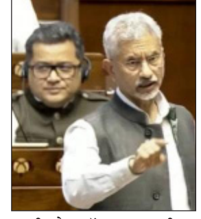
एकही फोन कॉल झाला नाही.

राज्यसभेत 'ऑपरेशन सिंदूर' वरील चर्चेदरम्यान परराष्ट्र मंत्री डॉ. एस जयशंकर म्हणाले, मी त्यांना सांगू इच्छितो की त्यांनी काळजीपूर्वक ऐकावे. २२ एप्रिल ते १६ जूनपर्यंत राष्ट्राध्यक्ष ट्रम्प आणि पंतप्रधान मोदी यांच्यात