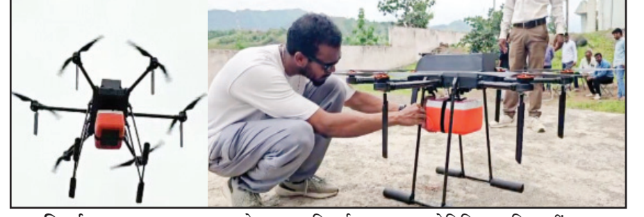
विदर्भ प्रजासत्ताक दि. २८ नंदुरबार

राज्यात अतिदुर्गम जिल्हा म्हणून ओळख असलेल्या गडचिरोलीनंतर नंदुरबारची ओळख आहे. नंदुरबार जिल्ह्यात आरोग्याच्या मोठ्या प्रमाणावर समस्या निर्माण होत आहेत. त्या दूर व्हाव्यात याकरिता प्रशासनाकडून दुर्गम भागात रस्त्यांअभावी प्राथमिक आरोग्य केंद्रांपर्यंत औषधी पोहोचविण्यासाठी मोठी मशागत करावी लागत होती. रुग्णांवर वेळेवर उपचार व्हावेत, या समस्येवर कायमस्वरूपी उपाय म्हणून ड्रोनद्वारे प्राथमिक आरोग्य केंद्र किंवा उपकेंद्रांपर्यंत फक्त १५ मिनिटांत औषधी पोहोचविल्या जातील, असा प्रयोग यशस्वी करण्यात आला आहे. यामुळे दुर्गम भागातील नागरिकांना आरोग्याबाबत येणाऱ्या समस्या काही प्रमाणात कमी होतील. म्हणून हा राज्यातील दुसरा यशस्वी प्रयोग राबविण्यात आला.