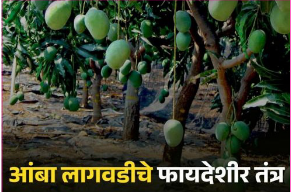
आंबा लागवडीचे फायदेशीर तंत्र

दि. २८ विदर्भ प्रजासत्ताक भारताव्यतिरिक्त मेक्सिको, ब्राझिल, चीन, दक्षिण आफ्रिका, ऑस्ट्रेलिया, इझ्राईल अशा अनेक देशांमध्ये आंबा उत्पादन होते. एकूण लागवड क्षेत्रामध्ये भारत आघाडीवर असला तरी भारताची हेक्टरी उत्पादकता ही अत्यंत कमी आहे. भारतात (हे. ८ टन), तुलनेत दक्षिण आफ्रिका (हे. ४० टन), इझ्राईल (हे. ३५ टन) असून उत्पादनाच्या बाबतीत आघाडीवर आहेत. त्यातही महाराष्ट्राची उत्पादकता सव्वा चार टन इतकीच आहे. उत्पादकतेमध्ये मागे असण्यामागे आजही कोणत्याही नवीन तंत्रज्ञानाच्या वापराविना पारंपरिक पद्धतीनेच लागवड केली जाते हे प्रमुख कारण दिसत आहे.