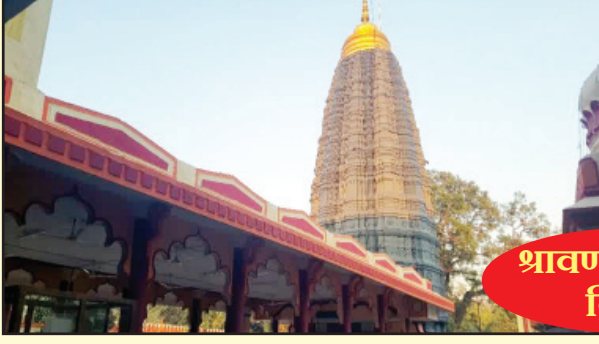
श्रावण सोमवार विशेष

विदर्भ प्रजासत्ताक दि. २८ अमरावती कोंडेश्वराचे मंदिर विदर्भ राज्याच्या काळात उभारण्यात आल्याचे सांगण्यात येते. सुमारे पाच हजार वर्षांपूर्वी या परिसरात राज्य असणाऱ्या विदर्भ राजा हे काशी क्षेत्रातील भगवान विश्वेश्वराचे भक्त होते. या विदर्भ राजाने आपल्या विदर्भ प्रदेशात कोंडेश्वर मुनींच्या आग्रहावरून शिवलिंगाची प्राणप्रतिष्ठा केली. या शिवलिंगाला कोंडेश्वर असे नाव देण्यात आले. आज पहिल्या श्रावण सोमवार निमित्त या मंदिरात भाविकांनी प्रचंड गर्दी केली होती.