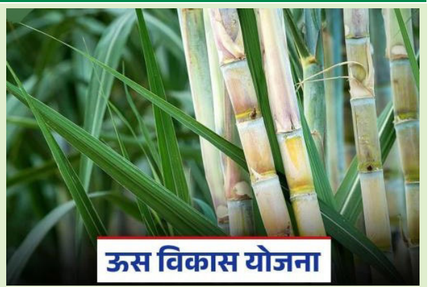
ऊस विकास योजना

मुलभूत बियाणे उत्पादनासाठी अर्थसहाय्य (कृषी विद्यापीठ प्रक्षेत्र) - रु.४०,०००/हे. ऊती संवर्धित रोपे - रु. ३,५०/रोप. पीक संरक्षण औषधे व बायो-एजंट्सचे वितरण - रु. ५००/हे. राज्यस्तरीय अधिकारी/कर्मचारी प्रशिक्षण - रु. ४०,०००/प्रशिक्षण. पाचट व खोडवा व्यवस्थापन प्रात्यक्षिके - रु. ६,०००/हे.