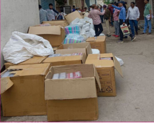
कारवाईदरम्यान नागरिकांना स्पष्ट शब्दांत आवाहन केले की, प्लास्टिकचा वापर केवळ कायद्यानेच नव्हे, तर आपल्या