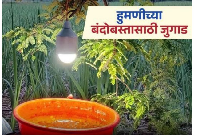
हुमणीच्या बंदोबस्तासाठी जुगाड