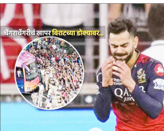
चेंगराचेंगरीचं खापर विराटच्या डोक्यावर...

बेंगळूरूमध्ये रॉयल चॅलेंजर्स बेंगळूरूच्या विजयाच्या जल्लोषादरम्यान झालेल्या चेंगराचेंगरीबाबत कर्नाटक सरकारने उच्च न्यायालयात आपला अहवाल सादर केला आहे. ३ जून रोजी खड्ड २०२५ चॅम्पियन झाल्यानंतर, उड्डने ४ जूनला अतिशय घाईघाईने आणि कसलेही नियोजन न करता विजयी परेड आयोजित केली. या अपघातात ११ जणांचा मृत्यू