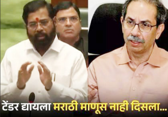
टेंडर घ्यायला मराठी माणूस नाही दिसला...

एकनाथ शिंदे म्हणाले, मुंबईबाहेर फेकलेला मुंबईकर