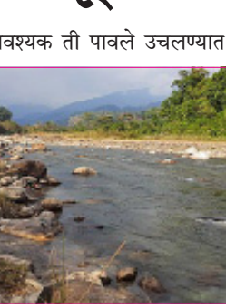
आवश्यक ती पावले उचलण्यात आली आहे. जिल्हा परिषदेच्या नोंदीनुसार जिल्ह्यातील सर्व १४ तालुक्यांमधून एकूण ५ हजार ८६७ जलनमूने घेण्यात आले होते. त्यापैकी २ हजार ११३ जलनमून्यांचे रासायनिक तर ३

हजार ७९६ जलनमून्यांचे जैविक परीक्षण करण्यात आले. दरम्यान रासायनिक परीक्षणात २८ ठिकाणचे पाणी दूषित आढळून आले असून जैविक परीक्षणात २६ ठिकाणचे पाणी पिण्यायोग्य नसल्याचे दिसून आले. त्यामुळे हे स्रोत तत्काळ बंद करण्यात आले असून तेथील नागरिकांसाठी पर्यायी व्यवस्था करण्यात आली आहे. सूत्रांच्या माहितीनुसार ज्या ठिकाणच्या जलनमून्यांचे परीक्षण