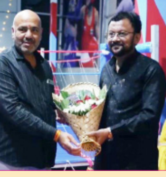
प्रामुख्याने उपस्थित होते. या प्रसंगी क्लबमध्ये सुरु करण्यात आलेल्या विविध क्रीडा सुविधा - बॉक्सिंग, स्कॅश, जिम, पोहणे, बॉक्स क्रिकेट, बॉक्स फुटबॉल, बॅडमिंटन, टेबल टेनिस, बिलियर्ड्स व एअर हॉकी यांची माहितीरंगोली स्पोर्ट्स क्लबस