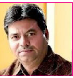
करणाऱ्या व्यक्ती व संस्थांना बळ मिळावे. यासाठी लोक फाउंडेशन, कृषी विकास प्रतिष्ठान, आझाद हिंद गणेशोत्सव मंडळ, न्यू आझाद हिंद गणेशोत्सव मंडळ व सोमेश्वर पुसतकर मित्रमंडळ या संस्थांच्या वतीने दरवर्षी पुसतकर