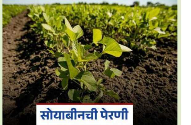
सोयाबीनची पेरणी पद्धतीपासून निव्वळ तुरीच्या तुलनेत प्रति एकर अधिक उत्पन्न मिळते. या गोष्टीही लक्षात असू द्या पेरणीच्या वेळी जमिनीमध्ये ओलावा असावा. एकरासाठी साधारणपणे ३० ते ४० किलो बियाणे पुरेसे असते. सोयाबीनचे बियाणे जास्त खोलवर पेरू नये, ज्यामुळे उगवण चांगली होईल. पेरणीनंतर तणांचे नियंत्रण करणे आवश्यक आहे.

दि. १० विदर्भ प्रजासत्ताक खोल पडणार नाही, याची काळजी घ्यावी. राज्यातील बहुतांश जिल्हा त समायोजनकारक पाऊस झाला आहे. पावसाचा अंदाज लक्षात घेता वापशावर (६५ ते १०० मी.मी. पाऊस) बीजप्रक्रिया करून सोयाबीन पिकाची पेरणी जुलैच्या पहिल्या आठवड्यापर्यंत पूर्ण करावी. कारण पेरणी जसजशी उशीरा होत जाईल, त्याप्रमाणे उत्पादनात मोठी घट होते. पेरणीचे अंतर दोन ओळीत ४५ सें.मी. व दोन रोपातील अंतर ५ सें.मी. अशा प्रकारे करावे. पेरणी करताना बियाणे ४ सें. मी. पेक्षा आंतरपीक पद्धती मध्यम ते भारी जमिनीत साधारण १५ जुलैपर्यंत पेरणी करून घ्यावी. अधिक चा उशीर होणार सर्वसाधारणपणे या आंतरपीक