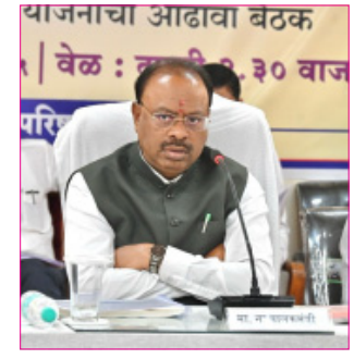
याजनाचा आढावा बैठक वेळ : सकाळी १० वाजेपर्यंत

जमिनींवर अनेक आदिवासी कुटुंबे दीर्घकाळपासून वास्तव्यास असून, त्यांना घरे बांधण्यासाठी जहागीरदारांकडून एनओसी घ्यावी लागत होती. काही प्रकरणांमध्ये जहागीरदारांकडून परवानगीसाठी पैसे मागितल्याच्या तक्रारीही शासनाकडे प्राप्त झाल्या आहेत. या संदर्भात मुंबई उच्च न्यायालयात दाखल असलेल्या प्रकरणात जहागीरदारांचे हक्क कायम ठेवले गेले आहेत. मात्र, या पार्श्वभूमीवर शासनाने पुढील तीन पर्यायांचा गांभीर्येने विचार सुरू केला आहे: महाराष्ट्र कुळ कायदा व शेतजमीन अधिनियम १९४८ मधील जहागीरदार अशी नोंद आहे. सदर