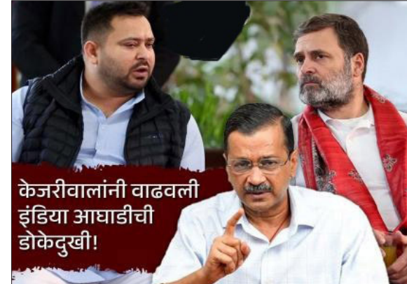
केजरीवालांनी वाढवली इंडिया आघाडीची डोकेदुखी!

बिहार विधानसभा निवडणुकीसाठी अरविंद केजरीवालांच्या नेतृत्वाखाली आम आदमी पक्षाने रणशिंग फुंकले आहे. बिहारमध्ये आप इंडिया आघाडीसोबत न जाता स्वबळाचा नारा दिला आहे. पक्षाचे राष्ट्रीय संयोजक अरविंद केजरीवाल यांनी याची घोषणा केली. केजरीवालांनी एकदा चलो अशी भूमिका घेतल्याने इंडिया आघाडीची डोकेदुखी वाढली आहे.