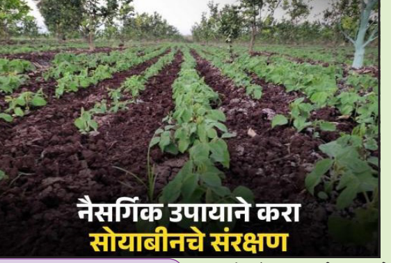
नैसर्गिक उपायाने करा सोयाबीनचे संरक्षण

शेतकरी ते थेट ग्राहक कामधेनु नॅचरल्स उत्तम आहार सर्वोत्तम जीवन विषमुक्त फळे, भाजी व धान्य एकाच ठिकाणी समर्थ हायस्कूल जवळ, अकोला अर्बन बँकेच्या बाजुने देवरणकर नगर, अमरावती