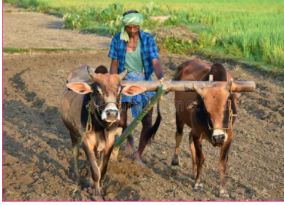
पंतप्रधान किसान सन्मान निधी योजनेचा लाभ दिला जात आहे. योजनेचा लाभ दिला जात आहे. मात्र ८ हजार १८९ शेतकऱ्यांनी ई

ईकेवायसी अभावी शेतकरी लाभापासून वंचित आहे. प्रधानमंत्री किसान सन्मान निधी योजनेच्या नावावर वार्षिक ६ हजार तर राज्याकडून नमो शेतकरी महासन्मान निधी वार्षिक ६ हजार आर्थिक मदद म्हणून शेतकऱ्यांच्या खात्यात जमा करण्यात येते. २०२३ मध्ये सुरु करण्यात आलेल्या या योजनेमध्ये जिल्ह्यातून तीन लाख ७० हजार २४ शेतकऱ्यांनी अर्ज केले. अल्प व मध्यमशेतकऱ्यांना या योजनेत लाभ देण्यात येतो. त्यापैकी दोन लाख ७६ हजार १८२ शेतकऱ्यांना