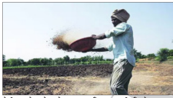
शेतीला जोडणारे रस्ते मजबूत होतील.

निर्णय घेतला आहे. याबाबतचा शासन निर्णय ३ एप्रिल रोजी प्रसिद्ध करण्यात आला आहे. राज्यातील शेतकरी, घरकुल लाभार्थी आणि शासकीय बांधकामांसाठी शेततळी, पाझर तलाव, महसुली नाले आणि बांधाऱ्यांमधून निघणारा गाळ, माती, मुरुम आणि दगड विनामुल्य मिळणार आहे. या निर्णयामुळे शेतकऱ्यांमध्ये सुधारण्यासाठी लागणारा मुरुम आणि माती शेतकऱ्यांना सहज उपलब्ध होईल, ज्यामुळे