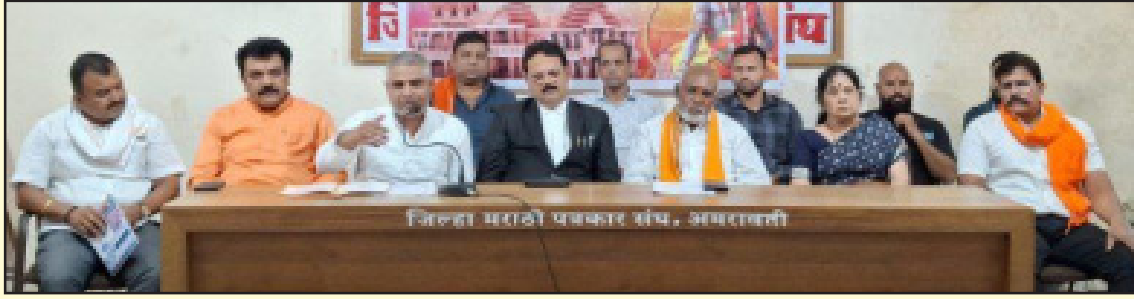
जिल्हा मठाठी पत्रकार परिषद, अमरावती

अमरावती शहरातील १९८५ पासून सुरू असलेली मानाची शोभायात्रा दर वर्षी प्रमाणे श्री राम नवमी शोभायात्रा समिती द्वारा आयोजित श्री राम नवमी चैत्र शुक्ल पक्ष नवमी कलियुग वर्ष ५१२७ रविवार दिनांक ६ एप्रिल २०२५ रोजी सायंकाळी ४:३० वाजता श्री राम नवमीचे मुहूर्तारंभ भव्य शोभायात्रेचे भव्य दिव्य असे आयोजन करण्यात आले आहे. शोभायात्रेच्या यशस्वीते करिता समिती गठीत करण्यात आली आहे. तसेच दिनांक २९ मार्च २०२५ ला श्री राम नवमी शोभायात्रेचे संपर्क कार्यालयाचे उदघाटन साधू संताच्या आशिर्वादाने संपूर्ण कार्यकारिणीच्या उपस्थिती मधे संपन्न झाले असल्याची माहिती आज पत्रकार परिषदेत आयोजन समितीच्या वतीने देण्यात आली.