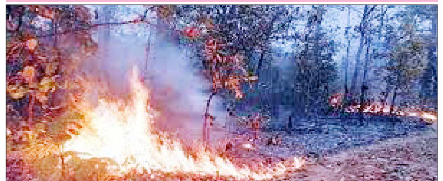
विदर्भ प्रजासत्ताक दि. २२ अमरावती

उन्हाचा पारा चढू लागल्याने वनविभाग अलर्ट भारतीय वन अधिनियमात शिक्षेची तरतूद