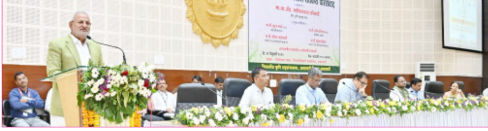
विदर्भ प्रजासत्ताक दि. १५ अमरावती

प्रत्येक भागातील जमीन वेगळी असल्यामुळे वेगवेगळी पीके घेण्यात येतात. यासाठी आपण घेत असलेल्या पिकांना अनुसरून पूरक व्यवसाय निवडणे गरजेचे आहे. शेती हा आपला कणा असून शेतकरी केंद्रबिंदू मानून कृषी नियोजन करण्यात येईल, असे प्रतिपादन कृषीमंत्री ड. माणिकराव कोकाटे यांनी आज येथे केले.