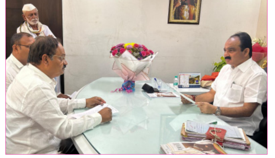
परिसरात मोठ्या प्रमाणात संत्रा निधी उपलब्ध करून देण्यात भारतीय जनता पक्षाचे बागा असून पाण्याची नितांत यावा याबाबत मागणी पदाधिकारी प्रामुख्याने उपस्थित गरज आहे. त्यामुळे त्वरित नोंदविण्यात आली, यावेळी होते.

झालेल्या फळबाग लागवड शेतकऱ्यांना नुकसान भरपाई देण्यात आली. त्याच धर्तीवर अमरावती जिल्ह्यात विशेष बाब म्हणून शेतकऱ्यांना आर्थिक मदत देण्यात यावी, याकरिता मुख्यमंत्री व मदत व पुनर्वसन मंत्री यांच्याकडे मागणीचे निवेदन देण्यात आले. मौजा लाखारा ता. मोशी येथील लघु सिंचन संग्रहक तलाव प्रकल्पास विशेष बाब म्हणून सुधारित प्रशासकीय मान्यता देण्याची विनंती केली. वरुड मोशी तालुक्यातील