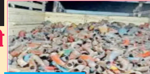
मराठवाड्यातील वाहनावर तेल्हारा पोलिसांची कारवाई नागरिकांना एमएच-२१-४४५१ या क्रमांकाचा ट्रक दिसून आला. नागरिकांनी मालवाहू वाहनाची पाहणी केली. यात गोवंशाची

एक्सल तुटल्याने वाहन थांबले एमएच-२१-४४५१ या क्रमांकाच्या वाहनाच्या चाकाच्या उजव्या बाजूचे एक्सल तुटले. याच ठिकाणी वाहन थांबले होते. वाहनावर नागरिकांची नजर पडली. या मालवाहू वाहनामध्ये पोती असल्याचे दिसून आले. वाहनामध्ये शिंगे दिसून आली. काही शिंगांना रंगही होता. गोवंशाची शिंगे हे गोवंशाची कत्तल करून गोवंशांच्या शिंगांची विल्हेवाट लावण्यासाठी घेऊन जात होती, अशीही चर्चा आहे. दरम्यान तेल्हारा तालुक्यातील दापुरा फाट्याचे मंगळवारी