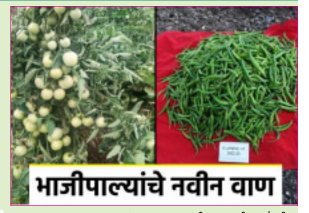
भाजीपाल्यांचे नवीन वाण

दि. १० विदर्भप्रजासत्ताक वाण प्रसाराणासाठीच्या दिनांक ५ ऑगस्ट २०२४ रोजी झालेल्या ३१व्या केंद्रीय उपसमितीच्या बैठकीत वसंतराव नाईक मराठवाडा कृषी विद्यापीठ, परभणीच्या उद्यानविद्या संशोधन (भाजीपाला) केंद्राने विकसित केलेले टोमॅटो आणि मिरची पिकांच्या वाणांस महाराष्ट्र