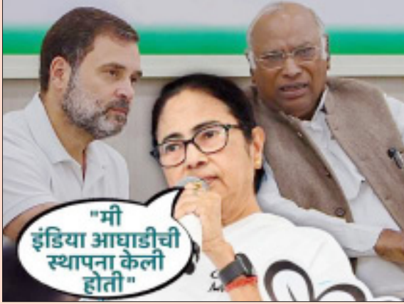
"मी इंडिया आघाडीची स्थापना केली होती"

इंडिया आघाडीचं नेतृत्व करण्यावरून पश्चिम बंगालच्या मुख्यमंत्री ममता बॅनर्जी यांनी काँग्रेसचा उल्लेख न करता नाराजी व्यक्त केली. महाराष्ट्र आणि हरयाणा विधानसभा निवडणूक निकालात इंडिया आघाडीची मानहानीकारक हार झाली. त्यानंतर आता विरोधी पक्षातील नेत्यांकडूनच इंडिया आघाडीच्या नेतृत्वाबद्दल नाराजी सुरू उमटण्यास सुरुवात झाली आहे. ममता बॅनर्जी यांनी याबाबत मोठे विधान केले असून, मी इंडिया आघाडीचे नेतृत्व करायला तयार आहे, असे त्या म्हणाल्या. ममता बॅनर्जींचं विधान काँग्रेससाठी