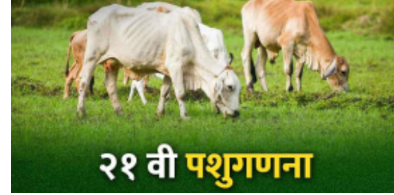
२१ वी पशुगणना