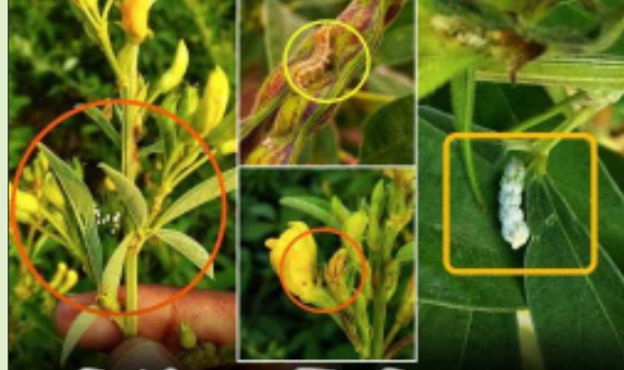
तूर पिकांतील 'एकात्मिक किड व्यवस्थापन'

दि. ३ विदर्भ प्रजासत्ताक तुरीचे पीक सध्या फुलोऱ्यात तसेच शेंगा लागण्याच्या अवस्थेत आहे. सद्यस्थितीत तूर पिकावर शेंगा पोखरणारी अळी, ठिपक्यांची शेंगा पोखरणारी अळी या किडींचा प्रादुर्भाव दिसून येत आहे. या किडींचा प्रादुर्भाव पिकाच्या उत्पादनावर गंभीर परिणाम करू शकतो. तसेच शेंगा पोखरण्या अळ्या शेंगांची हानी करतात ज्यामुळे शेंगांची संख्या कमी होऊ शकते परिणामी उत्पादन कमी होऊ शकते. यासाठी तूर पिकावरील किडीचे एकात्मिक किड व्यवस्थापन (IPM) करणे अत्यंत आवश्यक आहे. एकात्मिक किड व्यवस्थापनामध्ये जैविक नियंत्रण, रासायनिक नियंत्रण, आणि कृषी पद्धतींचा योग्य वापर केला जातो. यामध्ये पिकाच्या शारीरिक स्थितीचे निरीक्षण करणे, किडींच्या संख्येचे अचूक मूल्यांकन करणे, आणि योग्य वेळेस नियंत्रण उपाय राबवणे यांचा समावेश होतो. यामुळे उत्पादनात देखील वाढ होते.