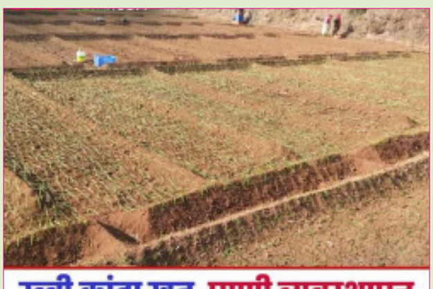
रब्बी कांदा खत, पाणी व्यवस्थापन

दि. २ विदर्भ प्रजासत्ताक रब्बी कांदा लागवडीची लगबग सुरू आहे. काही ठिकाणी रोपवाटिकेचे व्यवस्थापन सुरू आहे. अशा स्थितीत रब्बी हंगामातील कांदा व्यवस्थापन करताना पाण्याच्या पाळ्या आणि खत हे महत्त्वाचे घटक ठरतात. या लेखातून या दोन गोष्टींचा उहापोह करणार आहोत... तण नियंत्रण कांदा रोप लागवडी खालोखाल खुरपणीसाठी खूप खर्च येतो. खुरपणीमुळे मुळाशी हवा खेळती राहून कांदा चांगला पोसतो. रब्बी हंगामात तणांचा उपद्रव कमी असतो. कांद्याची रोपे लागवडीनंतर २५ दिवसांनी ऑक्झिफ्लोरफेन ७.५ मिली व क्यूझीलॉफॉफ इथाईल १० मिली प्रति १० लीटर पाणी या प्रमाणात तणनाशकाची एकत्रित फवारणी करून ४५ दिवसांनी एक खुरपणी करावी. खत व्यवस्थापन कांदा पिकास हेक्टरी ४०-५० बैलगाड्या शेंणखत व शिफारस केल्याप्रमाणे रासायनिक खत