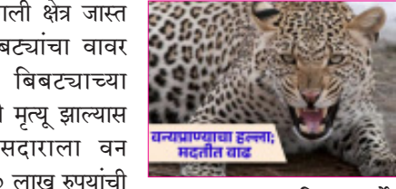
वन्यप्राण्यांचा हल्ला, मरतीत वाढ वारसदाराला वनविभागातर्फे २० लाख रुपयांची भरपाई दिली जायची. आता २५ लाख मिळतील.

दि. २ विदर्भ प्रजासत्ताक वन्यप्राण्यांच्या हल्ल्यात गंभीर जखमी, जायबंदी अथवा ठार झाल्यास देण्यात येणाऱ्या रकमेत वाढ करण्यात आली आहे. विशेषतः बिबट्यांच्या हल्ल्यात एखाद्या व्यक्तीचा मृत्यू झाल्यास २५ लाख रुपये भरपाईपोटी देण्यात येणार आहेत. ग्रामीण भागातील वाड्या, वस्त्यांपर्यंत त्याने हल्ले केल्याच्या बातम्या सतत येतात. बिबटे अन्न-पाण्याच्या शोधात मानवी वस्तीमध्ये येतात. शेतकऱ्यांची पाळीव जनावरे, वस्त्यांवरील भटकी कुत्री यांच्या शिकारी करतात. जिल्ह्याच्या पश्चिमेकडील तालुक्यांत ऊस