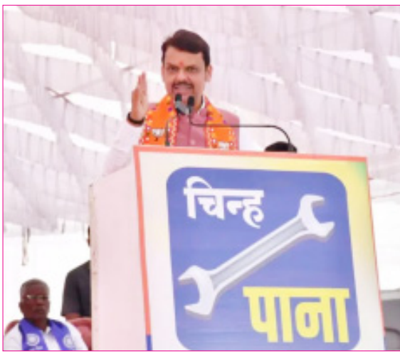
डोक्याचे नट कसायचे आहेत, त्यासाठी तुमच्या पान्याची

मतदारसंघात प्रचार करण्याची गरजच नाही. कारण त्यांचे निवडणूक चिन्ह 'पाना' आहे, याच पान्याने येत्या काळात महाविकास आघाडीच्या नेत्यांच्या डोक्याचे नट कसायचे आहेत, असे देवेंद्र फडणवीस म्हणाले होते. भाजपच्या कोट्यातून बडनेराची जागा रवी राणा यांना देण्यात आली असून त्यांचे बोधचिन्ह पाना आहे. ते कोणाकोणाचे नट कसतील माहीत नाही. पण आम्हालादेखील विरोधकांच्या