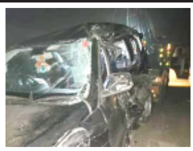
झाला. पहाटे तीन वाजण्याच्या सुमारास हे डॉक्टर प्रवास करत असलेली भरधाव स्कॉर्पियो दुभाजकावर आदळून दुसऱ्या लेनमध्ये गेली आणि समोरून येणाऱ्या ट्रॅक्टर आदळली. त्यात पाच जणांचा मृत्यू

विदर्भ प्रजासत्ताक दि. २७ आग्रा - उत्तर प्रदेशमधील आग्रा-लखनौ एक्सप्रेस-वेवर झालेल्या भीषण अपघातात सैफई मेडिकल युनिव्हर्सिटीमधील पाच डॉक्टरांचा मृत्यू झाला आहे. हे डॉक्टर लखनौ येथून आग्र्याकडे जात होते. त्यादरम्यान पहाटे तीन वाजण्याच्या सुमारास ते प्रवास करत असलेली स्कॉर्पियो भरधाव वेगाने दुभाजकावर आदळली आणि हा भीषण अपघात झाला. याबाबत मिळालेल्या माहितीनुसार आग्रा-लखनौ एक्सप्रेस वे वर कन्नोजवळील तिर्वा येथे हा अपघात