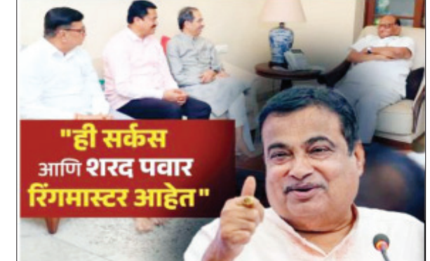
"ही सर्कस आणि शरद पवार रिंगमास्टर आहेत"

महाविकास आघाडीतील मुख्यमंत्रिपदासाठी इच्छुक असलेल्या नेत्यांना केंद्रीय मंत्री नितीन गडकरींनी चिमटा काढला. केस नसताना डोक्यावर कंगवा फिरवणारे खूप लोक असतात, असे गडकरी म्हणाले. महाविकास आघाडीला बहुमत मिळणार नाही, असे राजकीय भाकितही नितीन गडकरींनी केले.