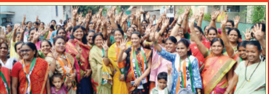
विदर्भ प्रजासत्ताक दि. ११ अमरावती

आजच्या आधुनिक युगात संगणक व मोबाईल क्रांतीमुळे माहिती, संवाद व शिक्षण अश्या अनेक बाबी आज जनतेला सहज उपलब्ध झाल्या आहे. ऑनलाईन पद्धतीचा जीवनात प्रत्यक्ष वापर होत असल्याने प्रत्येकाने डिजिटलाइझेशनची कास धरली आहे. नव्या डिजिटल युगात नव्या प्रगत संधी उपलब्ध होण्यासाठी व अत्याधुनिक तंत्रज्ञानातून विकासाला चालना देण्याकरिता एक नियोजित कृती कार्यक्रम तयार करण्यात आला आहे. आगामी काळात याला मूर्त रूप मिळण्यासाठी सर्वांची साथ मोलाची आहे. जनतेच्या जीवनात डिजिटल क्रांतीतून विकासाला आकार देत त्यांच्या जीवनात नवा बदल घडविण्यासाठी आपण प्रयत्नरत असल्याची खाही महायुतीच्या