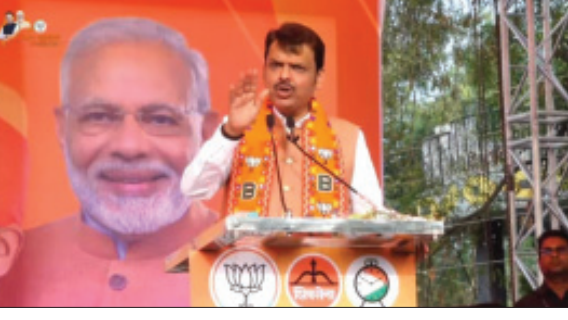
विदर्भ प्रजासत्ताक दि. ११ चिखलदरा

चिखलदरा येथील स्कायवॉकचे काम पूर्ण होत आले आहे. माजी खासदार नवनीत राणा यांनी सोबतच केबल कारची देखील मागणी केली आहे. या दोन गोष्टी जर एकत्र असतील, तर पर्यटकांचा ओघ मेळघाटात वाढणार आहे. याचा प्रस्ताव तयार करा, ते पूर्ण करण्याची जबाबदारी मी स्वीकारतो. २०१४ ते २०१९ पर्यंत मी मुख्यमंत्री असताना मेळघाटात मोठ्या प्रमाणावर विकास कामे हाती घेण्यात