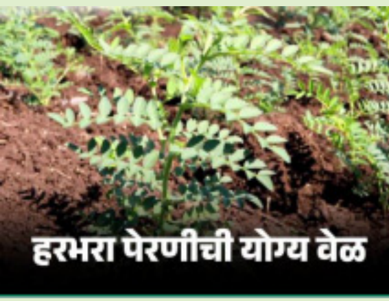
हरभरा पेरणीची योग्य वेळ

दि.११ विदर्भ प्रजासत्ताक - हरभरा हे महाराष्ट्र राज्यातील प्रथम क्रमांकाचे रब्बी पीक आहे. कडधान्यवर्गीय पिकांचा मोठा फायदा म्हणजे त्यांच्यात असलेली नत्र स्थिरीकरण करण्याची क्षमता. मुळावरील ग्रंथीतील रायझोबीयम जीवाणुमार्फत हवेतील १३५ किलो नत्र/हेक्टर शोषून त्याचे स्थिरीकरण केले जाते. त्यामुळे पुढील पिकास नत्र खताची उपलब्धता होते व जमिनीची सुपिकता वाढण्यास मदत होते.