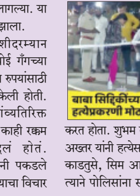
बाबा सिद्दिकीच्या हत्येप्रकरणी मोठा खुलासा!