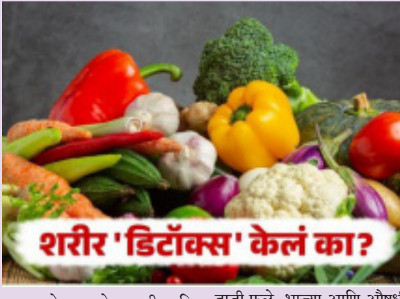
शरीर 'डिटॉक्स' केलं का?

दि.११विदर्भ प्रजासत्ताक दिवाळीत मिठाई, चकली, मूठभर चिवडा आणि तोंडभर लाडू यावर यथेच्छ ताव मारला जातो. उष्मांकाचे भरलेल्या अन्नपदार्थांमुळे शरीर आणि मन आळसावलेले असते. वर्षांतून एकदा हा आनंद लुटणे योग्य असले, तरी आता शरीराला आवश्यक विश्रांती देण्याची वेळ आली आहे. शरीराला जमा झालेली अतिरिक्त साखर आणि चरबीपासून शरीर 'डिटॉक्स' करून घ्या, असा सल्ला आहारतज्ज्ञांनी दिला आहे. 'डिटॉक्स' म्हणजे शरीरातील