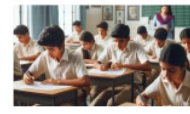
पुनर्परीक्षार्थी, नाव नोंदणी प्रमाणपत्र प्राप्त झालेले खाजगी विद्यार्थी, श्रेणीसुधार योजनेअंतर्गत व तुरळक विषय, आयटीआयचे (औद्योगिक प्रशिक्षण संस्थेद्वारे ट्रान्सफर ऑफ क्रेडिट घेणारे विद्यार्थी) विषय घेऊन प्रविष्ट होऊ

विदर्भ प्रजासत्ताक दि. ८ अमरावती - माध्यमिक शाळांत प्रमाणपत्र (इ. १०वी) फेब्रुवारी-मार्च २०२५ मध्ये होणाऱ्या परीक्षेस प्रविष्ट होऊ इच्छिणाऱ्या नियमित विद्यार्थ्यांची परीक्षेची आवेदनपत्रे शाळा प्रमुखांच्या माध्यमातून ऑनलाईन पद्धतीने भरण्यास १९ नोव्हेंबर २०२४ पर्यंत मुदतवाढ देण्यात आली असून ३० नोव्हेंबर २०२४ पर्यंत विलंब शुल्कासहित आवेदनपत्र भरता येणार आहेत. माध्यमिक शाळांनी नियमित विद्यार्थ्यांच्या परीक्षेची आवेदनपत्रे सरल डाटाबेस वरून ऑनलाईन पद्धतीने भरण्यासह