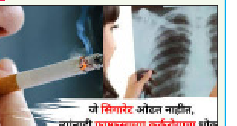
जो सिगरेट ओढत नाहीत, त्यांनाही फुफ्फुसांच्या कर्क रोगाचा धोका धूम्रपान करत नाहीत, त्यांनाही हा आजार होताना दिसतो. फुफ्फुसांच्या कर्करोगाचा धोका टाळण्यासाठी काय केले पाहिजे? धूम्रपान बंद करा - धूम्रपान बंद केल्याने फुफ्फुसांच्या कर्क रोगाची शक्यता मोठ्या प्रमाणावर कमी होते. हे व्यसन बंद करण्यासाठी तुम्ही निकोटिन रिप्लेसमेंट थेरपी, सामुपदेशन, सपोर्ट ग्रुप यांची मदत घेऊ शकता. रेडॉन एक्सपोजर - रेडॉन हे नैसर्गिकरीत्या उत्सर्जित होणारा किरणोत्सर्ग आहे. यापासून सावध राहिले पाहिजे. अजबरेटॉज आणि डिझोलेल्था ज्वलनामुळे निर्माण होणारे उत्सर्ग कर्करोगासाठी कारणीभूत ठरतात. जेवणात अ‍ॅटीऑक्सिडंट, व्हिटॅमिन, मिमरल अधिक असणाऱ्या पदार्थांचा समावेश असावा. आठवड्यात किमान १५० मिनिटे व्यायाम करणे आवश्यक आहे. मद्यसेवन मर्यादित ठेवा. हवेच्या प्रदूषणापासून स्वतःचा बचाव करा. कुटुंबास फुफ्फुसांच्या कर्करोगाचा इतिहास असेल तर तुम्हाला अधिक सजग राहिले पाहिजे.

बळवतो, तेव्हाच याचे निदान होण्याचे प्रमाण जास्त आहे. सहाजिकच यामुळे उपचारांवर मर्यादा येतात. त्यामुळे सुरुवातीची टप्प्यात हा आजार कसा ओळखता येईल आणि त्याचे निदान लवकरात लवकर कसे होईल, हा कळूचा मुद्दा आहे. मधून याबद्दल जनजागृती केली जाते. तसेच कर्करोगाबद्दल सामाजात नकारात्मक भावना आहे आणि हा आजार झालेल्यांनाच कलंकित केले जाते, याविरोधातही या महिन्यात जनजागृती केली जाते. धूम्रपान करणाऱ्यांना फुफ्फुसांचा कर्करोग होण्याची शक्यता जरी जास्त असली तरी जे