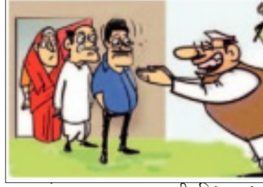
मंगळवारपासून आठही विधानसभा मतदारसंघात तडाख्यात प्रचार सुरू झाला आहे. महाविकास आघाडी आणि महायुतीच्या उमेदवारांकडून कॉर्नर सभा

विदर्भ प्रजासत्ताक दि. ८ अमरावती - महायुती आणि महाविकास आघाडी जिल्ह्यात तिन्ही मतदार संघात मैदानात उतरली आहे. जनसामान्यांचे गायब झालेले प्रश्न आता पुन्हा राजकीय प्रचाराच्या धुराव दिसणार आहेत. लोकासभेवेळी प्रचारात असलेले महागाई, बेरोजगारी, शेतीचे प्रश्न यासह अनेक मुद्दे याही वेळीही कायम आहेत. त्यावरून महाविकास आघाडी आक्रमक आहे, तर महायुतीची मदार निवडणुकीच्या तोंडावर जाहीर झालेल्या योजनांवर दिसत आहे.