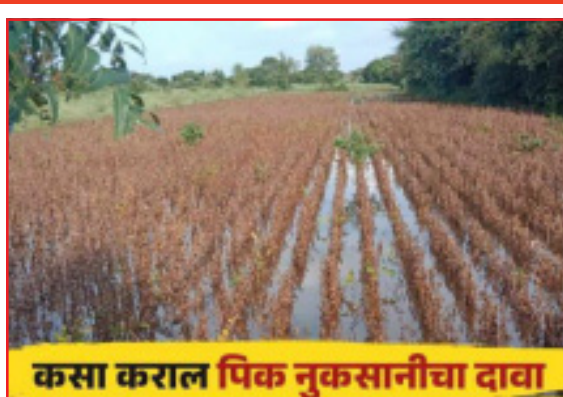
कसा कराल पिक नुकसानीचा दावा

शेतकऱ्याला शासकीय मदत व पिक विमा मदत पदरात पाडून घ्यावयाची असेल तर नुकसान झाल्यापासून ७२ तासांच्या आतमध्ये नुकसानीचा दावा तो ही ऑनलाइन कराव्याचा आहे. मात्र, पाऊस पडून किंवा पिकांचे नुकसान होऊन ७२ तास उलटले तरी शेतात पाणी साचलेले आहे किंवा नुकसानीपर्यंत जाणे अवघड होऊन बसले आहे, तर शासनाकडून पीक पंचनामा झाल्याशिवाय मदत मिळणार नाही. शिवाय पावसामुळे निर्माण झालेल्या तांत्रिक अडचणीही वेगळ्याच असतात. साचलेल्या पाण्यामुळे शेतामध्येच प्रवेश करता येत नाही, त्यामुळे नुकसानीचा दावा करावा कसा असा प्रश्न शेतकऱ्यांना भेडसावत आहे. या पाच पद्धतीने नोंदवता येणार तक्रार शेतकऱ्यांना क्रॉप इन्शुरन्स अॅप यामाध्यमातून झालेल्या नुकसानीची माहिती स्वतः भरायची आहे, याद्वारे माहिती भरल्यानंतर अधिकारी कर्मचारी हे पंचनाम्यासाठी शेतकऱ्यांच्या बांधावर येणार आहेत.