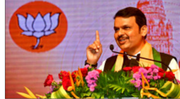
आता तलवार म्यान नाही