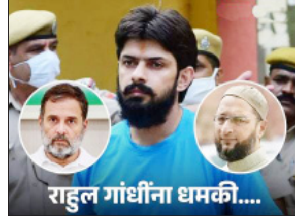
राहुल गांधींना धमकी....

काही दिवसापूर्वी मुंबई माजी मंत्री बाबा सिद्दिकी यांची हत्या करण्यात आली. या हत्येनंतर लॉरेन्स बिश्रोईची टोळी पुन्हा चर्चेत आली. दरम्यान, आता आणखी एक मोठी बातमी समोर आली आहे. काँग्रेस नेते राहुल गांधी आणि एमआयएमचे नेते ओवैसी यांना सोशल मीडियावरून धमकी आली आहे. लॉरेन्स बिश्रोईच्या फोटोसह ही धमकी फेसबुकवर शेअर करण्यात आली असून या प्रकरणी गुन्हा दाखल केला आहे.