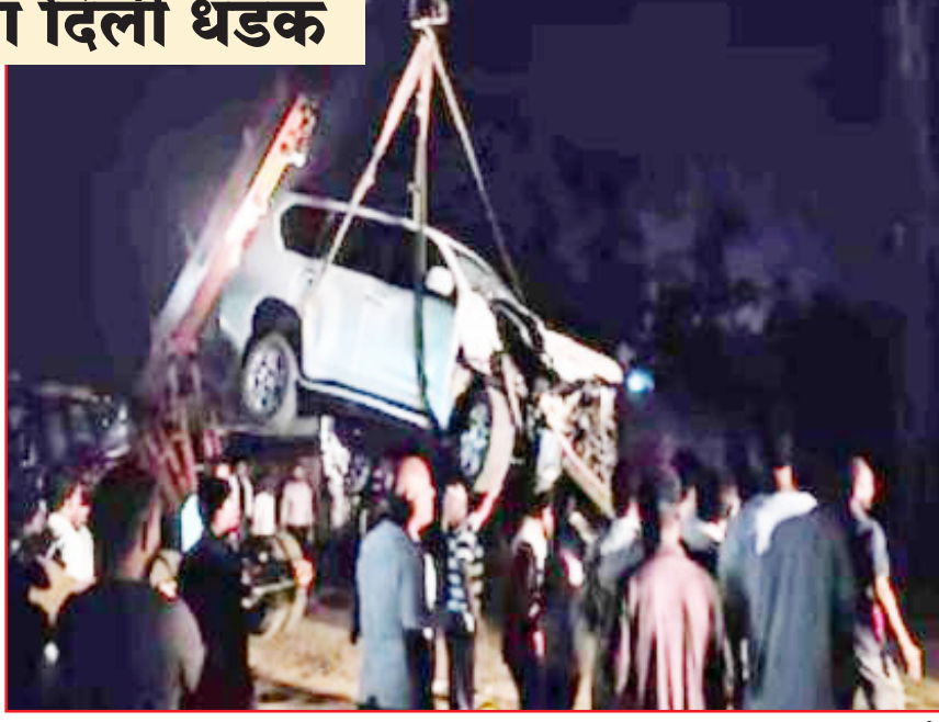
झड्डेवर जखमी झाला आहे. समोर असलेल्या पिकअपचा झड्डेवरही जखमी झाला आहे.