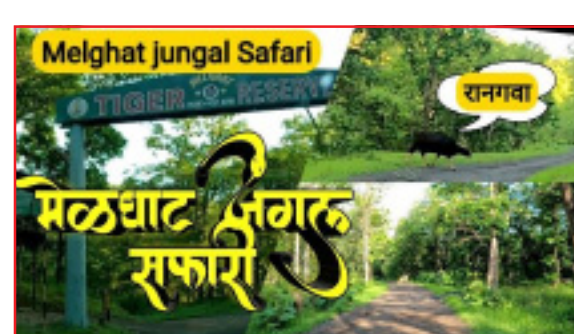
विदर्भातील पर्यटकांमध्ये तसेच स्थानिक जिप्सी चालक-आनंदाची वातावरण आहे. मालक्यांच्यामध्ये सुद्धा

पावसाळ्यात जंगल सफारी बंद असते, कारण पावसाळ्यात रस्त्यांची अवस्था दयनीय असते. जंगलातले रस्ते पावसामुळे खराब होतात. त्यामुळे पावसाळ्यात जंगल सफारी बंद असल्यामुळे पर्यटकांना जंगलसफारीचा आनंद घेता येत नाही. आजपासून चिखलदरा जंगल सफारी सुरू झाल्यामुळे