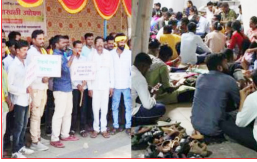
सकारात्मक प्रतिसाद देत १ आंगस्टपासून नाशिक व इतरही आदिवासीबहुल जिल्ह्यात सुरू असलेले उपोषण मागे घेतले होते. मात्र, अद्यापही अंतिम शिफारस झालेल्या उमेदवारांना नियुक्ती आदेश मिळालेले नाहीत. त्यामुळे अनुसूचित क्षेत्रातील बेरोजगार आदिवासी

विदर्भ प्रजासत्ताक दि. ३ अमरावती :- राज्यातील पेसा क्षेत्रातील १३ जिल्ह्यांत १७ संवर्गांमधील अंतिम शिफारस प्राप्त आदिवासी उमेदवारांना अद्याप्यंत नियुक्ती आदेश मिळालेले नसल्यामुळे ३० सप्टेंबरपासून बेरोजगार आदिवासी उमेदवारांनी मंत्रालयाच्या बाहेरच ठिथ्या मांडला आहे. मुलांजवळ पैसे नसल्यामुळे ते उपाशीपोटीच उघड्यावर मंत्रालयाबाहेर झोपले आहेत. तर यवतमाळात गत आठ दिवसांपासून आदिवासी उमेदवार साखळी उपोषणाला बसले आहेत.