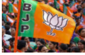
यावेळी पद्धत बदलली असून, बंद लिफाफ्यात उमेदवारांचे नाव

मतदारसंघातील भाजपचे भावी उमेदवार कोण? यासाठी प्रत्येक विधानसभा मतदारसंघातील पदाधिकाऱ्यांकडून गुप्त मतदानाद्वारे चाचपणी होणार आहे. याचाच अर्थ विधानसभा निवडणुकीसाठी भाजप उमेदवार