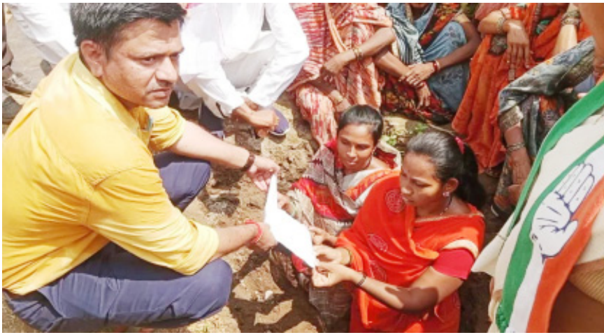
'आंदोनात्मक हिसका' दाखविला की 'साहेब' थेट आंदोलनाच्या दारी आले. बुधवारी (२ ऑक्टोबर) हे

विदर्भ प्रजासत्ताक दि. ३ बुलढाणा : एरवी शासकीय अधिकारी, कर्मचारी हे ग्रामस्थ किंवा जन सामान्यासोबत साहेबगिरीच्या अविर्भावात वागतात. त्यांचा पाणउतारा करतात, टोचून कडक बोलतात असा सर्वांचा अनुभव आहे. अगदी कुणी अन्यायाविरुद्ध आंदोलन केले तरी तिकडे लवकर ते हुंकूनही पाहत नाही, असे परिस्थिती सगळीकडे आहे. मात्र, बुलढाणा जिल्ह्याच्या आदिवासी बहुल संग्रामपूर तालुक्यातील एका महिला सरपंचांनी असा काही