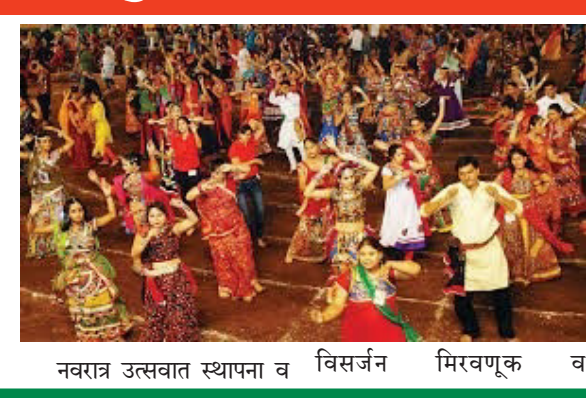
नवरात्र उत्सवात स्थापना व विसर्जन मिरवणूक व

विदर्भ प्रजासत्ताक दि. ३ अमरावती आज ३ ऑक्टोबरपासून नवरात्रौत्सवाला सुरुवात झाली असून, शहरात ४९२ ठिकाणी दुर्गादेवी व १०२ ठिकाणी शारदादेवीची स्थापना करण्यात आली आहे. यादरम्यान १२ ऑक्टोबरपर्यंत शहरात ६४ ठिकाणी गरबा कार्यक्रमाचे आयोजन केले जाणार आहे. त्यातील सर्वाधिक २२ ठिकाणे ही राजापेट पोलीस ठाण्याच्या हद्दीतील आहेत. नवरात्रौत्सवावर शहर पोलिसांची करडी नजर असताना विशेषकरून गरबा कार्यक्रमावर खाकीचा करडा वॉच राहणार आहे. त्यासाठी पोलीस ठाणेनिहाय विशेष पथकासह दामिनी पथकेही वाढविण्यात आली आहेत. गरब्यावर सहा दामिनी पथकांचा वॉच राहणार आहे.