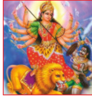
नवरात्र आणि कुमारीका पूजन नवरात्रामध्ये हवन यज्ञाला

वावरत असते आणि दहाव्या दिवशी ती शुभनिशुंभ या राक्षसांचा वध करण्यास समर्थ होण्यासाठी सीमा उल्लंघन करते. अशा या देवीचे हे नऊ रूप आपण बघितल्यानंतर, तिचे जे नऊ दिवसांचे आपल्या घरातले जे मंगलमय वास्तव्य असते, त्यात कोणी उपवास एकभक्त व्रत किंवा यापैकी एका व्रताचा नियम करून तिची आराधना केली जाते.