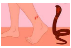
आवश्यक असलेली सर्व औषधे पुरविण्यात येतात; परंतु बहुतांश आरोग्य केंद्रात उपचाराच्या सुविधा असतानाही येथील डॉक्टर उपचार न करताच, संबंधित रुग्णांना ग्रामीण रुग्णालय किंवा जिल्हा सामान्य रुग्णालयात रेफर करतात. त्यामुळे उपचारासाठी होणाऱ्या विलंबामुळे रुग्णांची

सर्वाधिक घटना या ग्रामीण भागातल्या असल्या, तरी सर्वाधिक ५०५ रुग्ण हे उपचारासाठी जिल्हा सामान्य रुग्णालय (ईर्विन) येथे भरती झाले होते. पावसाळ्याच्या दिवसांमध्ये सर्पदंशाच्या घटनांमध्ये मोठ्या प्रमाणावर वाढ होते. ग्रामीण भागात सर्पदंशाच्या घटना सर्वाधिक होतात. सर्पदंश झालेल्या व्यक्तीला तातडीने उपचार मिळणे गरजेचे असते. त्यामुळे प्राथमिक आरोग्य केंद्र, तसेच उपकेंद्रांमध्ये ही सर्पदंशावरील उपचारासाठी