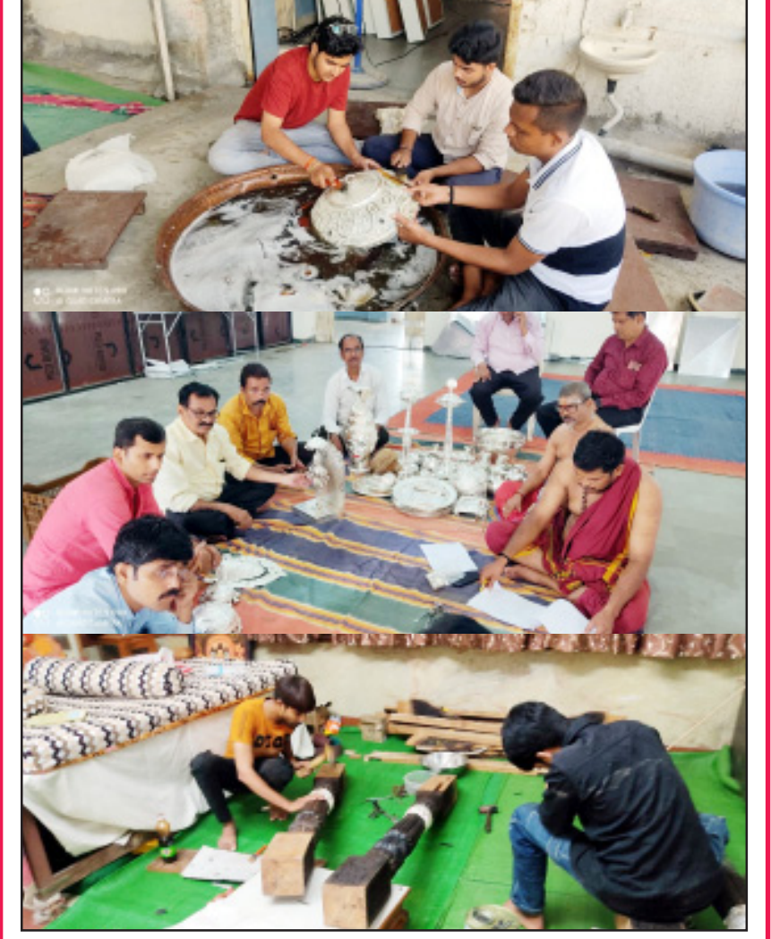
अमरावती च्या एकविरा देवी व अंबादेवी मंदिरात नवरात्र उत्सवाची तयारी सुरू करण्यात आली. रविवारी एकविरा देवीचे आभूषण स्वच्छ करून त्याला पालीश करण्यात आली. तर दुसऱ्या छाय्याचित्रात श्री एकविरा देवी मंदिरात नवरात्र उत्सव निमित्ताने चांदीचे स्वांब तयार करण्यात येत आहे, नाशिक येथील कारागीर हे काम करित आहे.