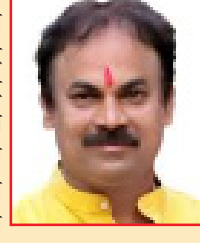
जवळपास २०० कोटीचा नुकसान झालेले आहे. या तक्रारीमुळे खळबळून जागे होऊन आता संबंधित अधिकारी मागील वीस वर्षांपासून ज्या भूसाफियांना मदत केलेली आहे व त्यांना आजपर्यंत कोणतेही कर मागणी नोटीस पाठवलेली नाही त्यांच्यापासून सामान्य जनतेने भूखंड घेतल्यामुळे आता त्यांना मागील वीस वर्षांची कर मागणी करण्यात येत आहे. परंतु मागील वर्षात जर महानगरपालिकेने कर मागणी नोटीस दिल्या नसेल तर त्या वर्षांचे