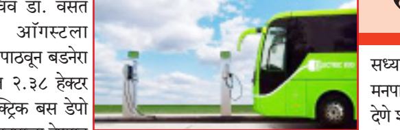
केंद्र सरकारकडून आलेले ५ कोटी रुपये तसेच पडून राहणार आहेत. या शासकीय जमिनीची किंमत बघता मनपाने २.५ कोटी रुपये मागितले आहेत. कारण,