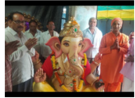
श्री संत गुलाबपुरी महाराज, ज्वालामिग्री महाराज, वीरशैव मठ या धार्मिक स्थळांपैकी वीरशैव मठावर दरवर्षी गणेशोत्सव साजरा होतो. पंचक्रोशीतील या सर्वांत मोठ्या उत्सवात दहा दिवस लागतच्या सर्व गावातील दिंड्या या उत्सवात हजेरी लावतात. इसवी सन १६३ साली या मठाची स्थापना झाली. गणेश विसर्जनाचा पहिला मानही परंपरेने याच गणपतीला चालत आला आहे. ढोल- ताशाच्या निनादात 'श्री'च्या मिरवणूक निघते.

राज्यभरातील लाराडू भाविकांचे कुलदैवत असलेल्या पिंगळादेवी गडाच्या पायथ्याशी वसलेल्या नेरपिंगळाई गावातील गणेशोत्सवाला ऐतिहासिक वारसा आहे. धर्म आणि राजकारण यांची योग्य सांगड घालणाऱ्या आणि संत गाडगेबाबा, राष्ट्रसंत तुकडोजी महाराज, संत अच्युत महाराज यांच्यासह देशाच्या विविध भागांतील संत महात्म्यांच्या पावन स्पर्शाने पावन झालेल्या भूमीत गणेश उत्सवाचा सोहळा थाटात साजरा