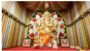
महानगरपालिकेची परवानगी घेतलेल्या सार्वजनिक गणेशोत्सव मंडळांना सहभागी होता येईल.

महापालिकेकडून करण्यात आले आहे. महानगरपालिका क्षेत्रातील सार्वजनिक गणेशोत्सव मंडळांनी राबविलेले पर्यावरणपूरक उपक्रम, जनजागृती आदी बाबीचे मूल्यमापन करून पुरस्कार देण्यासंदर्भातील बाय विचाराधीन आहे. सदर स्पर्धेत