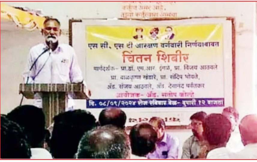
आहे. ही भीती दूर करण्यासाठी व आरक्षणाचे रक्षण करण्यासाठी संसदेत कायदा करण्याची गरज असल्याचे मत आरक्षणाचा आधार प्रामुख्याने