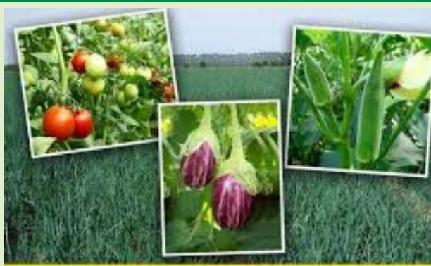
टोमॅटो, वांगी, कांदा, भेंडी पिकावरील रोगांचे नियंत्रण

पाण्यातून फवारावे. वांगी पिकावरील फळकुजव्या तसेच पानावरील ठिपके रोगाचे नियंत्रण वांगी पिकावरील फळकुजव्या तसेच पानावरील ठिपके रोगाच्या नियंत्रणासाठी मॅकोझेब २५ ग्रॅम किंवा कार्बेन्डिझिम १० मि.ली. १० लिटर पाण्यातून फवारावे.