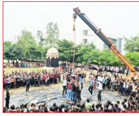
पारितोषिक मिळविले. आधुनिक युगाकडे वाटचाल करत असताना आपले महाराष्ट्रातील साजरे होणारे सण उत्सव या नवीन पिढीने सुद्धा अंगिकारावे तसेच दहीदांडी या सोहळ्याच्या

विदर्भ प्रजासत्ताक दि. ३ अमरावती- पी. आर. पोटे पाटील एज्युकेशनल ग्रुप अमरावती येथे गोकुळाष्टमी च्या पार्श्वभूमीवर नुकताच दहीदांडी चा सोहळा म हा विद्यालयातील विद्यार्थ्यांकरिता संपन्न झाला. यामध्ये विद्यार्थ्यांनी मोठ्या उत्सवात डीजे च्या तालावर नाचत पावसाचा आनंद घेत दांडीचा उपयोग करत मटकी फोडली. पी. आर. पोटे पाटील एज्युकेशनल ग्रुप अंतर्गत येणाऱ्या अभियांत्रिकी, फार्मसी, कृषी, आयुर्वेद, आर्किटेक्चर, नर्सिंग महाविद्यालयांच्या विद्यार्थी व विद्यार्थिनींच्या जवळपास ४२ स्वतंत्र चमू ने या स्पर्धे मध्ये सहभाग घेतला. या स्पर्धेत मानवी मनोरे रचत दांडी चा उपयोग करत मटकी फोडण्याच्या अनोखा प्रयोग असल्याने विद्यार्थ्यांनी सुद्धा मोठ्या उत्साहात सहभाग घेतला. या स्पर्धेत मुलांमध्ये पी. आर. पोटे पाटील अभियांत्रिकीच्या सीव्हील इंजिनिअरिंग विभागाने प्रथम पारितोषिक पटकावले तसेच द्वितीय पारितोषिक एमसीए च्या विद्यार्थ्यांनी मिळविले. त्याचप्रमाणे मुलींमध्ये पी. आर. पोटे पाटील कृषि महाविद्यालयाने प्रथम पारितोषिक तर पी. आर. पोटे पाटील अभियांत्रिकीच्या कॉम्प्युटर सायन्स अँड इंजिनिअरिंग विभागाने दुसरे