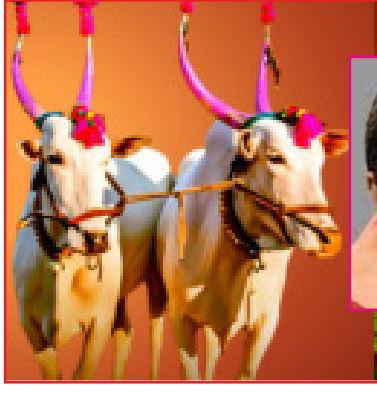
बैलजोडी, लोकशाही आणि संविधान वाचवा संदेश देणारी बैलजोडी, वाढती बेरोजगारी संदेश देणारी बैल जोडी, वाढते

महिला अत्याचार बाबत संदेश देणारी बैल जोडी, सरकारच्या चुकीच्या ध्येयधोरणांचा संदेश देणारी बैल जोडी, शेतकऱ्यांना सरकारकडून अपेक्षित असलेल्या मागण्यांचा संदेश देणारी बैल जोडी, राष्ट्रीय एकात्मतेचा संदेश देणारी बैल जोडी, देशाच्या जडणघडणीत काँग्रेसच्या असलेला सहभाग संदेश देणारी बैलजोडी शेतकऱ्यांच्या शेतमालाला भाव नसल्याच्या व्यथा