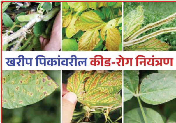
खरीप पिकांवरील कीड-रोग नियंत्रण

१० लिटर पाण्यामध्ये मिसळून फवारणी करावी. ८. मका पिकावरील लष्करी अळीच्या नियंत्रणासाठी थायोमिथॉक्झाम १२.६% लॅमडा सायहॅलोथ्रीन ९.५% झेडसी २.५ मीली प्रति लीटर पाण्यात किंवा क्लोरॅन्ट्रोनीलीप्रोल १८.५ एससी, ३ मीली प्रति १० लिटर पाण्यात मिसळून फवारणी पावसाची उघडीप पाहून करावी. ९. भात पिकांत निळे भुंगेरेचा प्रादुर्भाव आढळून आल्यास नियंत्रणासाठी किनोलेफॉस २५ टक्के प्रवाही २० मि.ली. किंवा लॅमडा सायहॅलोथ्रीन ५ टक्के प्रवाही ५ मि.ली. प्रति १० लिटर पाण्यातून पावसाची तीव्रता कमी असताना व स्टीकरचा वापर करून फवारणे. १०. मुग पिकावर भुरी रोगाचा प्रादुर्भाव दिसून येत आहे, नियंत्रणासाठी कार्बेन्डॅझिम या बुरशीनाशकाची १० ग्रॅम प्रति १० लिटर पाणी याप्रमाणात मिसळून फवारणी पावसाची उघडीप पाहून करावी.