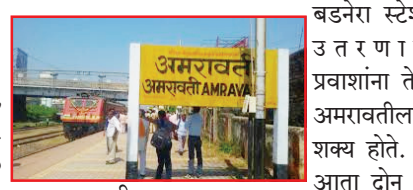
बडनेरा स्टेशनवर उतरणारी अमरावती-बडनेरा शटल सेवा

करून इतर पर्यायी साधनांचा वापर करावा लागणार आहे. शटल क्र. ०९३७५ बडनेरा ते अमरावती, शटल क्र. ०९३७६ अमरावती ते बडनेरा, शटल क्र. ०९३७७ बडनेरा ते अमरावती, शटल क्र. ०९३७८ अमरावती ते बडनेरा, शटल क्र. ०९३७९ बडनेरा