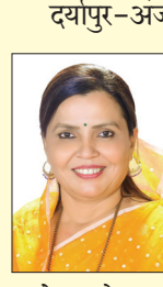
दर्यापुर-अंजवगाव परिसरातील काही महिला माझ्याकडे तक्रार घेऊन आल्या. दर्यापुर-अंजवगाव येथील बँकेत हा प्रकार घडला असल्याने इतर ठिकाणी माहिती घेतली असता असा प्रकार अनेक ठिकाणी घडला असल्याचे समोर आले आहे. काही ठिकाणी नवऱ्याच्या किंवा आई-वडिलांच्या जॉईंट अकाउंट मध्ये जमा झालेल्या पेश्यातून सुद्धा बँकांनी दंड / कर्ज वसूली सुरु केली आहे.

निराशा आली आहे. लाडकी बहिण योजनेतून प्राप्त झालेल्या रकमेतून बँकांची वसूली सुरु केली आहे. लाडकी बहिण योजनेत मिळालेल्या रकमेतून मिनिमम बॅलन्सच्या नावाखाली बँकांकडून सुरु असलेली वसूली तातडीने थांबविण्यात यावी यासाठी राज्याचे मुख्यमंत्री यांनी तातडीने आदेश काढावेत. तसेच बँकांनी मिनिमम बॅलन्सच्या