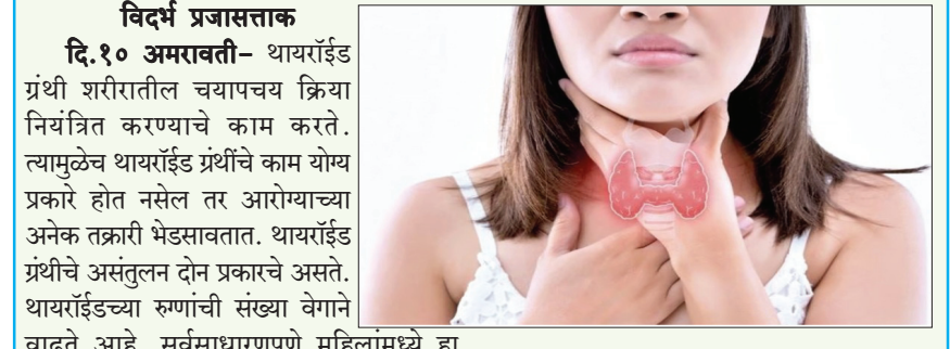
थायराईडमुळे वजन वाढल्यास करा हे उपाय...