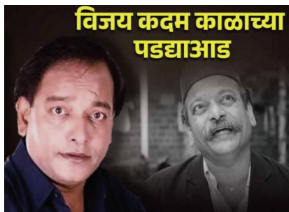
विजय कदम काळाच्या पडद्याआड

मराठी मनोरंजन विश्वातील लोकप्रिय अभिनेते विजय कदम यांचे निधन झाले. ते ६७ वर्षांचे होते. विजय कदम गेल्या अनेक वर्षांपासून मराठी रंगभूमी आणि सिनेसृष्टीत कार्यरत होते. कॅन्सरची झुज अपयशी झाल्याने विजय कदम यांनी आज सकाळी अखेरचा श्वास घेतला. अंधरी येथील स्मशानभूमीत आज त्यांच्या पार्थिवावर अंत्यसंस्कार करण्यात येणार आहेत. विजय कदम यांच्या निधनाने हरहुन्नरी कलाकार ह्रपल्याची भावना सर्वांच्या मनात आहे.