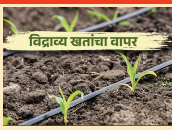
विद्राव्य खतांचा वापर

विद्राव्य खते ही मातीतून दिल्या जाणाऱ्या रासायनिक खतांच्या तुलनेत पिकांना लवकर उपलब्ध