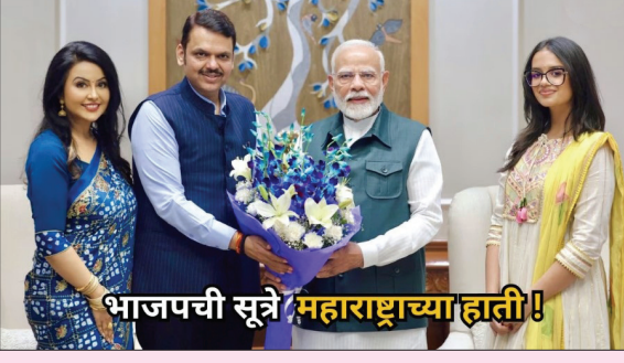
भाजपची सूत्रे महाराष्ट्राच्या हाती!

त्यामुळे या पदासाठी ज्या नावाची चर्चा सुरु आहे, त्यामध्ये उपमुख्यमंत्री देवेंद्र फडणवीस यांचे नाव आघाडीवर आहे. याबाबतचे वृत्त द न्यू इंडियन एक्सप्रेसने दिले आहे. जेपी नड्डा यांच्या अध्यक्षपदाचा कार्यकाळ यापूर्वीच संपला होता, पण त्यांना मुदतवाढ देण्यात आली होती. आता केंद्रात पुन्हा सरकार स्थापन झाल्यानंतर भाजपने नव्या अध्यक्षचा शोध सुरु केला आहे. यामध्ये दोन प्रमुख नावे महाराष्ट्रातून आहेत. त्यात उपमुख्यमंत्री देवेंद्र फडणवीस आणि पक्षाचे सरचिटणीस विनोद तावडे