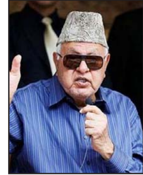
जागावाटपाबाबत काँग्रेसने एक समिती स्थापन केली असून, त्यात मुकुल वासनिक, अशोक गेहलोत, भूपेश बघेल, सलमान खुशीद आणि मोहन प्रकाश यांचा समावेश करण्यात आला आहे. या नेत्यांना विविध पक्षांच्या नेत्यांशी चर्चा करून जागावाटपाची रूपरेषा ठरवण्याची जबाबदारी देण्यात आली आहे. मात्र, अद्याप कोणत्याही राज्यात जागावाटपाबाबत निर्णय झालेला नाही. दरम्यान, इंडिया आघाडीसाठी सर्वात कठीण परिस्थिती पश्चिम बंगालमध्ये असल्याची चर्चा आहे. तृणमूल काँग्रेसने लोकसभा निवडणुकीसाठी काँग्रेसला फक्त दोन जागा देण्याचा प्रस्ताव ठेवला आहे. काँग्रेसने हा प्रस्ताव फेटाळला असून, अधीर रंजन चौधरी यांनी या प्रस्तावावरून ममता बॅनर्जी यांच्यावर तोफ डागली आहे. याशिवाय इंडिया आघाडीतील सीपीआय आणि सीपीआयएमलाही काही जागा सोडाव्या लागणार आहे. पण, यावर अद्याप कोणतीही चर्चा झालेली नाही.

जागावाटपावरून मतभेद कायम, अजूनही एकमत नाही लोकांमध्ये निवडणुकांसाठी विरोधक एकत्रित लढण्याचा प्रयत्न करत आहेत. मात्र, इंडिया आघाडीतील पक्षांमध्ये जागावाटपाचे घोडे अडले आहे. पश्चिम बंगाल, पंजाब, दिल्ली, उत्तर प्रदेश, बिहार आणि केरळसह अनेक राज्यांमध्ये पक्षांमध्ये एकमत झालेले नाही.