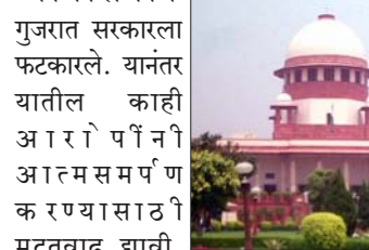
मुदतवाढ घावी, यासाठी जी कारणे सादर केली आहेत, त्यात काहीच तथ्य नाही. त्यामुळे ही याचिका फेटाळली जात आहे, असे न्यायालयाने स्पष्ट केले. या