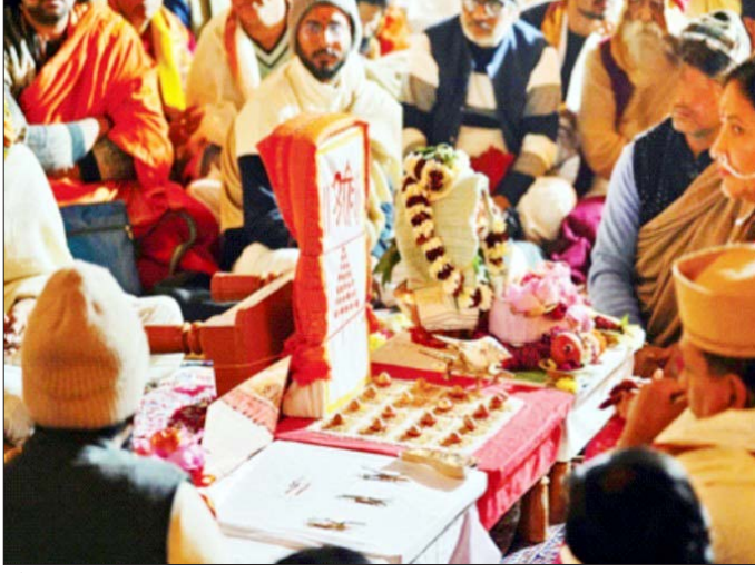
अौषधाधिवास, केसराधिवास, पुष्पाधिवास हे विधी होणार आहेत. केंद्रीय कार्यालये, बँकांना अर्धा दिवस सुट्टी अयोध्येतील राम मंदिरातील

अभिषेक सोहळ्यामुळे २२ जानेवारी रोजी देशभरातील सर्व केंद्र सरकारी कार्यालये अर्धा दिवस बंद राहणार आहेत, असे कार्मिक मंत्रालयाने गुरुवारी जाहीर केले. सार्वजनिक बँका, ग्रामीण बँका आणि विमा कंपन्या, वित्तीय संस्था व केंद्र सरकारी कार्यालयांना या दिवशी अर्धा दिवस सुट्टी जाहीर झाली आहे.