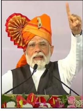
खायला मिळेल' असेही बोलले जायचे; पण का? आता मोदी आहे, तुम्हाला पूर्ण भाकरी मिळेल, असेही मोदी म्हणाले.

देशात 'गरीबी हटाव' च्या अनेकदा केवळ घोषणा देण्यात आल्या; पण गरीबी कधीच हटली नाही. 'आधी भाकरी तरी