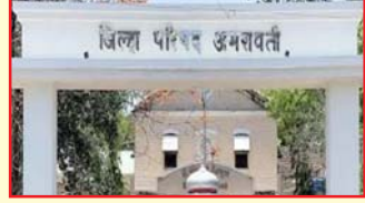
तपासणीदरम्यान स्पष्ट होतात. त्यासाठी जिल्हा परिषदेच्या वेगवेगळ्या विभागांमध्ये या तपासणीच्या अनुषंगाने तयारी केली जात आहे. तर, काही विभागात तपासणी सुरू झाली आहे.

दि. १८ विदर्भ प्रजासत्ताक अमरावती - गत मंगळवार ९ जानेवारीला तपासणी केल्यानंतर १५ जानेवारीपासून जिल्हा परिषदेत विभागीय तपासणी चमू दाखल झाली आहे. या तपासणी पथकाकडून ९ विभागांमार्फत केंद्र व राज्य शासनाच्या विविध योजनांची वास्तविकता जाणून घेण्याचा प्रयत्न या तपासणी दरम्यान केला जातो. योजनेला लाभार्थ्यांपर्यंत