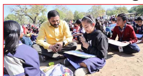
रेखाटनकरीता विनामुल्य ड्राईंग शीट पुरविल्या जाणार आहेत. यात सहभागी सर्व विद्यार्थ्यांना

आली आहे. ग्रामीण भागातील विद्यार्थ्यांच्या परीक्षा शिकत असलेल्या शाळेत होणार असून वरुड शहरातील विद्यार्थ्यांच्या परीक्षा स्थानिक न्यु इंग्लिश हायस्कूल वरुड, ता. वरुड, जि. अमरावती येथे भव्य प्रांगणात होणार आहे. चित्रकला स्पर्धा सर्व विद्यार्थ्यांकरीता विनामुल्य राहणार असून चित्र