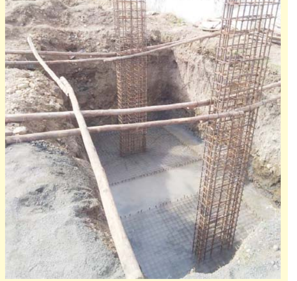
भाजपचे खासदार आणि आमदार काय भूमिका घेतात या कडे सर्वांचे लक्ष आहे.