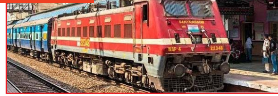
१०:३० ला, तर सकाळी ११:१५ ची विदर्भ दुपारी एक वाजता गोंदिया स्थानकावर पोहोचत असल्याने प्रवाशांची

त्रस्त; तर रेल्वे विभाग यावर तोडगा काढण्याऐवजी सुस्त असल्याचे चित्र आहे. महाराष्ट्र एक्सप्रेसची गोंदिया रेल्वेस्थान कावर पोहोचण्याची वेळ सायंकाळी ६:३० वाजताची असून ती गाडी थेट रात्री १० ते