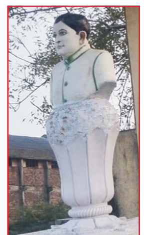
विकून मोकळे झाले पुतळा मात्र तिथेच सोडला अखेर पुतळा सुद्धा हलवायचा व नातेवाईकांच्या ताब्यात घाबचा उरला असताना