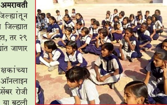
आहे. या वर्षीच्या शैक्षणिक वर्षाच्या शेवटी अथवा नव्या शैक्षणिक वर्षाच्या सुरुवातीला प्रत्यक्ष या बदल्या होतील. पधरा दिवसांपासून आंतरजिल्हा बदली

जिल्हा परिषद शिक्षकांच्या आंतरजिल्हा बदली प्रक्रिया ऑनलाइन सांगणकीय प्रणालीद्वारे ३० डिसेंबर रोजी मध्यरात्री पूर्ण करण्यात आली. या बदली प्रक्रियेत शिक्षकांना सकाळी सुखद धका देत ईमेलवर बदली आदेश प्राप्त झाले आहेत. राज्यस्तरीय ऑनलाइन बदली पोर्टलवरून या बदल्यांवर शिक्षामोर्तब केले