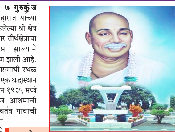
गुरुदेवभक्तांमध्ये आनंदाची लाट

दि. ३० विदर्भ प्रजासत्ताक ७ गुरुकुंज मोझरी- राष्ट्रसंत श्री तुकडोजी महाराज यांच्या पावनभूमीतील महाराजांनी स्थापन केलेल्या श्री क्षेत्र गुरुकुंज आश्रमाला चक्र २० वर्षांनंतर तीर्थक्षेत्राचा 'अ' दर्जा शासनाकडून प्राप्त झाल्याने गुरुदेवभक्तांमध्ये आनंदाची लाट निर्माण झाली आहे. राष्ट्रसंत तुकडोजी महाराज यांचे महासमाधी स्थळ हे देश-विदेशातील लाखो भाविकांचे एक श्रद्धास्थान आहे. राष्ट्रसंत तुकडोजी महाराजांनी सन १९३५ मध्ये राष्ट्रीय महामार्गावर श्रीक्षेत्र गुरुकुंज-आश्रमाची स्थापना करून गुरुदेवनागर या स्वतंत्र गावाची स्थापना केली. श्री क्षेत्र गुरुकुंज आश्रम हे स्वातंत्र्यपूर्व लढ्यातील महत्त्वाचे केंद्र होते. या स्थळास तत्कालीन राष्ट्रीय नेत्यांनी अनेकदा नियमित भेटी दिल्या. त्यामुळे मानवतेचे दर्शन घडणार्या या तीर्थक्षेत्राला शासनाकडून 'अ' दर्जा मिळवावा, ही मागणी अखिल भारतीय श्री गुरुदेव सेवा मंडळाने २००५ पासून रेटून धरली होती. आज २० वर्षांनंतर गुरुदेवभक्तांच्या या मागणीला यश मिळाले आहे.