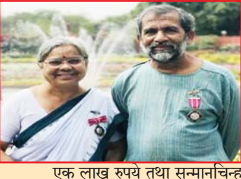
एक लाख रुपये तथा सन्मानचिन्ह पंजाबचे राज्यपाल बनवारीलाल पुरोहित यांच्या हस्ते भाजपा प्रदेशाध्यक्ष चंद्रशेखर बावनकुळे यांच्या अध्यक्षतेत रविवार, २४