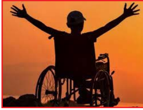
महामंडळ मर्यादित यांचे स्तरावरून सुरू आहे. योजनेचा उद्देश : दिव्यांग व्यक्तींनी प्रुेशा सोयी सुविधा उपलब्ध करून देण्यात येणार. दिव्यांग व्यक्तीचे आर्थिक, सामाजिक पुनर्वसन करणे. सर्वसामान्य व्यक्तीप्रमाणे दिव्यांग व्यक्तींनी त्यांच्या परीवार, कुटुंबासमवेत जीवन जगण्यास सक्षम करणे होय.

योजनेचा लाभ घेण्याचे आवाहन दि. २३ विदर्भ प्रजासत्ताक अमरावती , महाराष्ट्र राज्य दिव्यांग वित व विकास महामंडळमार्फत दिव्यांग व्यक्तींना स्वावलंबी होण्यासाठी हरीत उर्जेवर चालणाऱ्या पर्यावरणसुद्धेची फिरत्या वाहनावर दुकान योजनेंतर्गत मोफत उपलब्ध करून देण्यात येत आहे. या योजनेचा गरजू दिव्यांग व्यक्तींनी लाभ घेण्यासाठी दि. ४ जानेवारी २०२३ पर्यंत ऑनलाईन अर्ज सादर करावा, असे आवाहन महाराष्ट्र राज्य दिव्यांग वित व विकास महामंडळचे जिल्हा व्यवस्थापक यांनी केले आहे. शासन निर्णय दि.१० जून २०१९ नुसार गरजू दिव्यांग व्यक्तींना योजनेंतर्गत फिरते वाहनावर दुकान