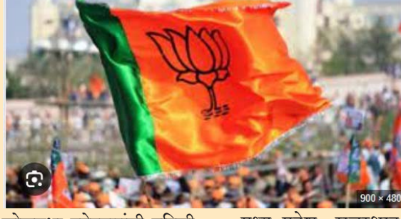
लोकसभा उमेदवारांची पहिली यादी जाहीर करणार आहे. मध्य प्रदेश, राजस्थान, छत्तीसगड, तेलंगणा आणि

दिली आहे. विधानसभा निवडणुकीच्या धर्तीवर लोकसभा निवडणुकीची तारीख जाहीर होण्यापूर्वीच उमेदवारांची घोषणा सुरू होणार आहे. जानेवारीच्या शेवटच्या आठवड्यात पहिली यादी जाहीर होऊ शकते. पुढील वर्षी २२ जानेवारीला रामलह्यांच्या प्राणप्रतिष्ठापनेनंतर भाजप