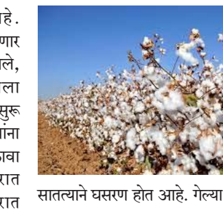
सातत्याने घसरण होत आहे. गेल्या कापसाला ६ हजार ७७५ रुपये

केंद्र सुरू झाले नाही, त्यामुळे, स्पष्ट नसल्याने त्याचा परिणाम शेतकऱ्यांच्या कापसाला कमी दर मिळण्यात होऊ लागला आहे. कापूस पणन महासंघाने प्रयत्न करूनही सरकारने खरेदीची परवानगी दिलेली नाही. सलग दुसऱ्या वर्षी महासंघास परवानगी