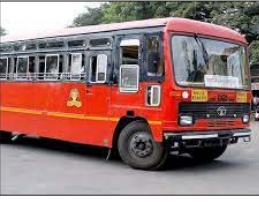
अग्रिश्रम उपकरणे व प्रथमोपचार पेठ्या नाहीत. याकडे महामंडळाचेही दुर्लक्ष होत आहे. प्रथमोपचार पेठ्या गहाळ झाल्यामुळे अपघात झाल्यास

होते. मात्र, हा उपक्रम अल्पावधीतच अयशस्वी ठरला. सद्यःस्थितीत बसेसमधील वायफाय सुविधा बंद आहे. प्रवासी स्वतःचे मोबाइल वाजवून मनोरंजन करतात.