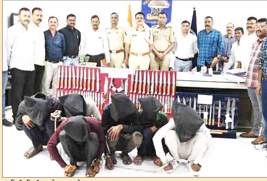
माहिती दिली आहे. त्यामुळे भरपुर शस्त्रसाठा जप्त होण्याची शक्यता आहे.

राज्यातील सर्वात मोठी अवैध शस्त्र जप्तीची ही कारवाई असल्याचा प्राथमिक अंदाज असल्याचे पोलीस आयुक्तांनी सांगितले. अटकेतील युवकांनी आतापर्यंत । कोणकोणत्या गुन्हेगारांना शस्त्रे विकली त्यांची